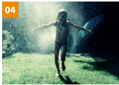
04 Ferien vom Ausnahmezustand