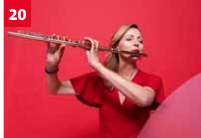
20 Internationales Niederrhein Musikfestival