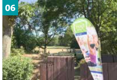
06 Draußen Sport machen