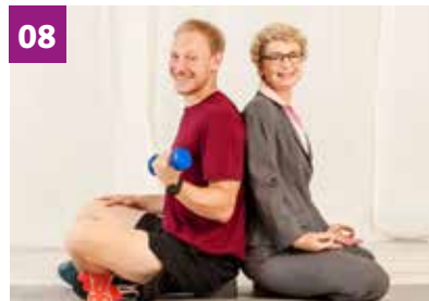
08 Ratgeberbuch zur Stressbewältigung