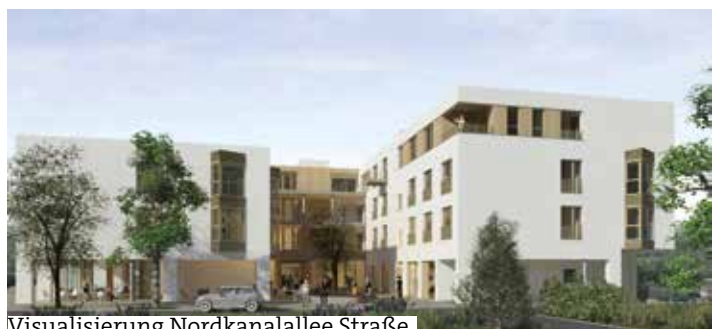
Visualisierung Nordkanalallee Straße