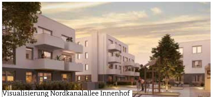
Visualisierung Nordkanalallee Innenhof