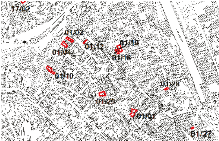
Ausschnitt aus dem Baulückenplan