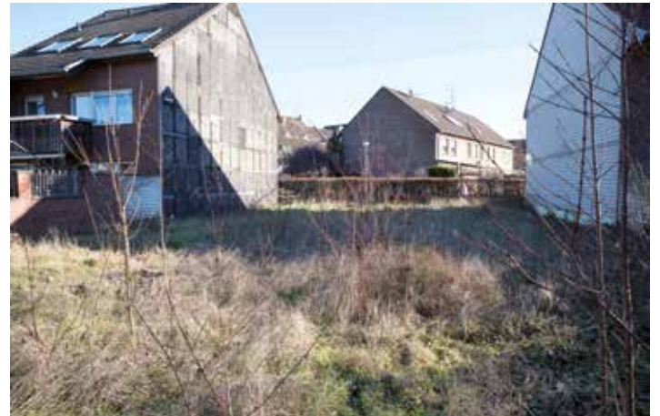
Baulücken sind leider Mangelware

Leider scheitern die Wünsche vieler Familien jedoch an den aktuellen Marktpreisen und am mehr als dürftigen Angebot auf dem Grundstücks- und Wohnungsmarkt, denn der sieht in unserer Stadt nicht üppig aus. Dazu kommt, dass die heute geforderten Preise für Neu- und Gebrauchtimmobilien, sowie für Baugrundstücke auf einem sehr hohen Niveau angesiedelt sind und das mit einer seit mehreren Jahren steigenden Tendenz.