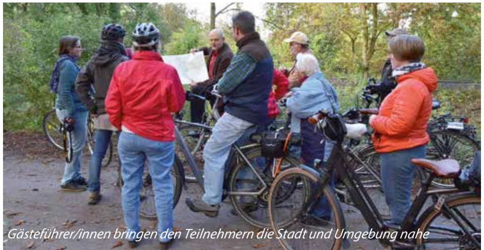
Gästeführer/innen bringen den Teilnehmern die Stadt und Umgebung nahe

Den Kreis von aktuell zwölf Gästeführern/innen, die auf Honorarbasis tätig sind, würde Neuss Marketing gerne erweitern. Die historischen und kulturellen Werte der Stadt bei Führungen vermitteln zählt zu den Kernaufgaben. Darüber hinaus wäre es interessant und gewünscht, neue Touren zu interessanten Themen zu erarbeiten. Die wichtigsten Voraussetzungen: Freude am Umgang