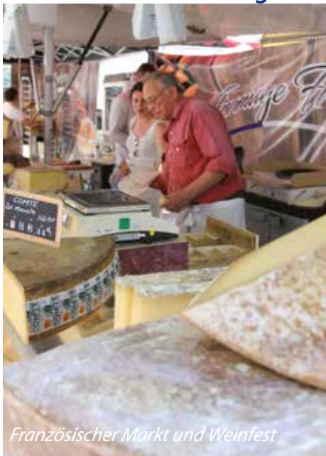
Französischer Markt und Weinfest

Eine große Auswahl an französischen Köstlichkeiten bietet auch in diesem Jahr wieder der Französische Markt, der