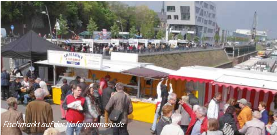
Fischmarkt auf der Hafenpromenade

an der Neusser Hafenpromenade startet am 14. April 2019