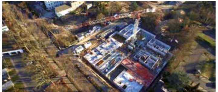
Baustelle Augustinuspark Nordkanalallee Februar 2019

Weitere Projekte im Stadtgebiet sind in Arbeit: Durch den Dachausbau des Gebäudebestands an der Römerstraße sollen weitere 31 Wohnungen gewonnen werden. Oder: Am Hohen Weg in der Neusser Nordstadt werden vier viergeschossige Mehrfamilienhäuser mit insgesamt rund 50 öffentlich geförderte Mietwohnungen entstehen. An der Josef-Wirmer-Straße in Weckhoven werden die Grundrisse des Mehrfamilienhauses so umgestaltet, dass 26 neue bezahlbare Mietwohnungen geschaffen werden und an der Willi-Graf-Straße werden zwei Mehrfamilienhäuser mit insgesamt 43 öffentlich geförderten Mietwohnungen errichtet.