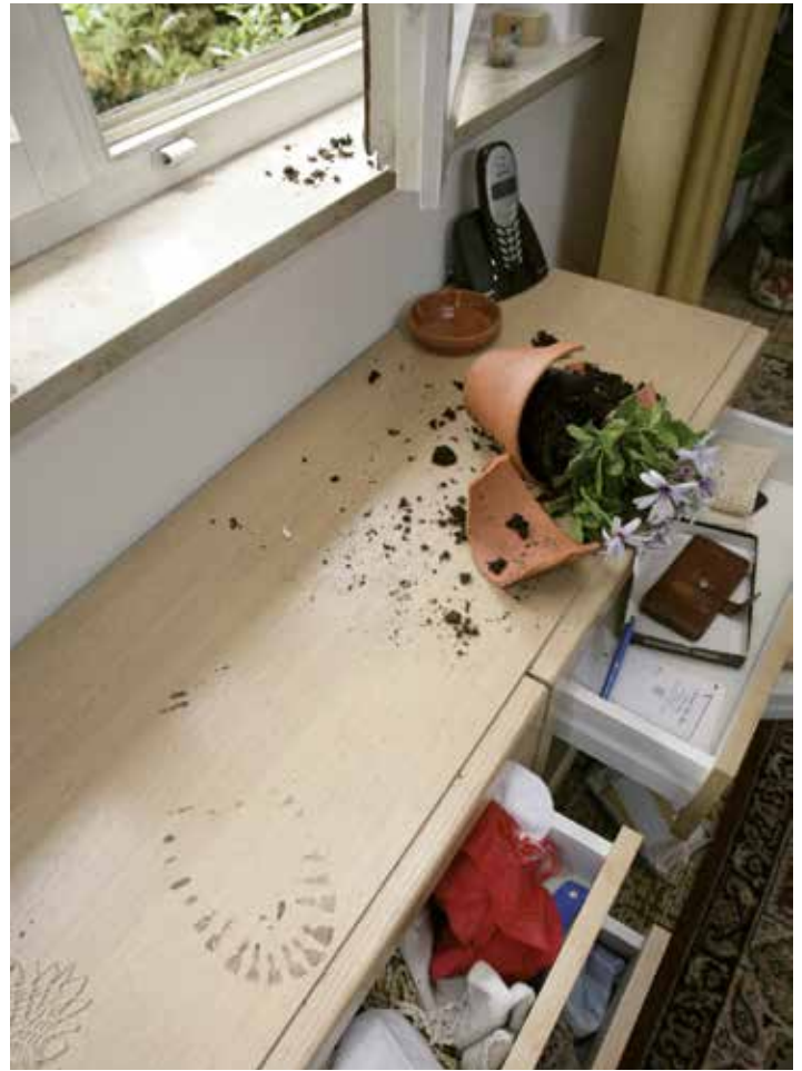
Pressebilder Quelle: Polizeiliche Kriminalprävention des Landes und des Bundes, www.polizeiberatung.de

„Das Durchwühlen von Schränken und Schubladen ist ein Eingriff in die Intimsphäre. Das wiegt oft schwerer als jeder materielle Verlust. Deshalb ist es gut, dass sich immer mehr Bürger beraten lassen, wie sie ihre vier Wände besser schützen können.“ Das betonte NRW Innenminister Herbert Reul anlässlich der Präventionskampagne der nordrhein-westfälischen Polizei: „Riegel vor! Sicher ist sicherer.“ Im