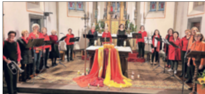
Der Chor „All together“ aus Gierath stimmt mit einem adventlichen Singen auf die Weihnachtszeit ein.