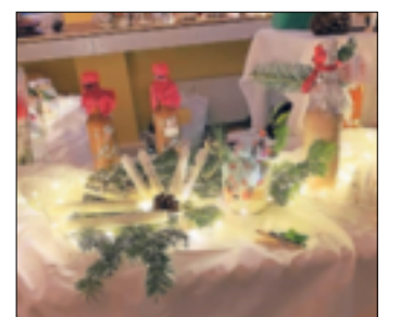
An den liebevoll dekorierten Ständen gab es viel zu entdecken.