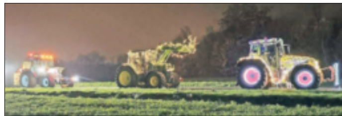
Die Zuschauer am Straßenrand erfreuten sich an den bunt beleuchteten Traktoren.