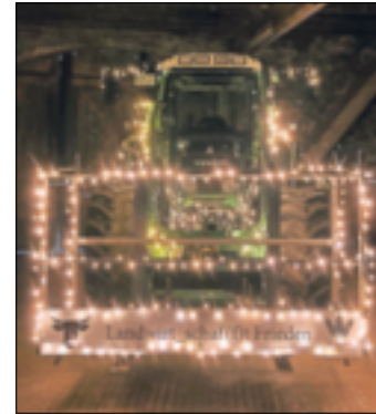
Auch Banner kamen zum Einsatz, um die Botschaft der Aktion zu verbreiten.

Rund vier Stunden waren die über 30 Traktoren auf ihrer Tour von Schelsen nach Hochneukirch unterwegs. Auf dem Zielparkplatz sei es dann noch einmal richtig voll geworden. „Der Andrang war sehr groß. Und leider haben die Besucher unseren Parkplatz zugeparkt“, lacht Deußen, „das war kurzzeitig ein kleines Verkehrschaos, aber das konnten wir schnell beheben.“ Schon bei dem gemütlichen Ausklang waren sich die Teilnehmer einig: Im nächsten Jahr sind sie