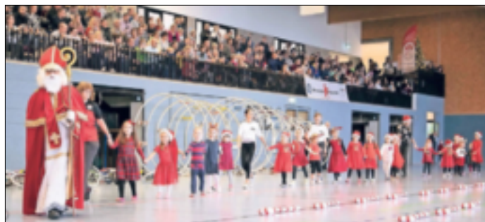
Der Nikolaus war natürlich auch dabei.