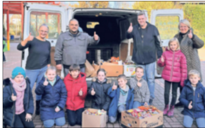
Kistenweise Süßigkeiten spendeten die Kids an die Tafel.

Jüchen spenden, die sich sehr über diese Spende freute. Wie alle Tafeln in NRW verzeichnet auch die Tafel in Jüchen aktuell einen erhöhten Zulauf. „Nächstes Jahr schaffen wir noch mehr!“, ist sich Hugo aus der 3. Klasse sicher. In jedem Fall soll diese tolle Aktion im kommenden Jahr wiederholt werden. -tkd