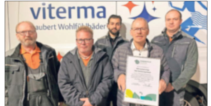
Viterma Korschenbroich trägt das Siegel „klimaneutrales Unternehmen“.

Nachhaltigkeit und Klimaschutz sind entscheidende Themen in unserer Gesellschaft und spielen auch bei den Badexperten von Viterma eine wichtige Rolle. Bereits seit 2017 arbeitet die Zentrale des Unternehmens klimaneutral, seit 2021 die gesamte Unternehmensgruppe. Zudem werden mit einem eigenen Nachhaltigkeitsteam konkrete Projekte umgesetzt und das nachhaltige Denken und Handeln unter den Mitarbeitenden gefördert. Auch in diesem Jahr setzt Viterma sein Engagement in diesem Bereich fort. Mit dem Kauf von hochwertigen Klimaschutzzertifikaten kompensiert Viterma die emittierte Menge an CO 2 , damit diese an andere Stelle des Globus vermieden wird. Für das Erreichen der Klimaneutralität hat der Viterma Fachbetrieb aus Korschenbroich alle notwendigen Vorarbeiten geleistet. Dazu wurden ökologische