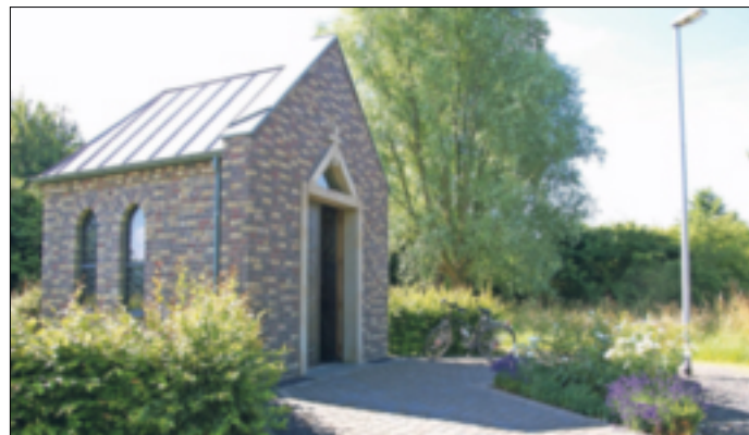
Am Sonntag wird der Kolpinggedenktag am Friedenskapellchen gefeiert.

Fahrten koordinieren. Bei Regen findet der Gottesdienst in der evangelischen Kirche statt. Traditionell wird nach dem Gottesdienst zum gemeinsamen Frühstück ins evangelische Gemeindehaus eingeladen. Wie in den Vorjahren wird im Laufe des Morgens auch der Nikolaus die Kinder besuchen. Dafür wird um kurze telefonische Anmeldung bei Gisela Wienands, Telefon 02165/87 21 45, gebeten. Im Anschluss der Feier wird ein Frühschoppen sein, der gegen 13 Uhr endet. Der Vorstand der Kolpingsfamilie freut sich auf einen Kolpinggedenktag mit vielen Gästen. -tkd