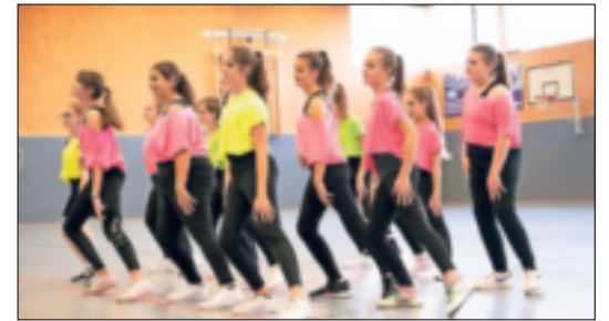
Vor vollen Zuschauerrängen zeigten die jungen Sportler ihr Können.