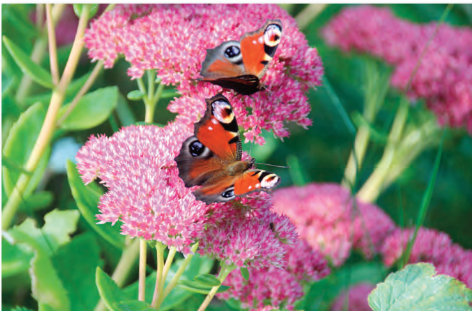
Die Tagpfauenaugen bedienen sich an sonnigen Nachmittagen am Nektar der Hohen Fethenhe.

zehn Monate. Benötigen die Gemüsebeete eine Anbaupause, sät man Gründüngung aus, z.B. Inkarnatklie, Winterroggen oder Bienenfreund. Nützlicher Nebeneffekt: Der Bewuchs schützt die kostbare Humusschicht in der kalten Jahreszeit vor dem Einfluss der Elemente, sie wird nicht weggeweht oder weggespült. Vor Regen geschützt reifen im Gewächshaus Tomaten zu roten, gelben und dunkelvioletten, aromatischen Früchten, die Pflanzen reichen inzwischen bis zum Dach. Durch Kappen der Triebspitzen und regelmäßiges Ausgeizen der Seitentriebe leiten sie bis zum Saisonende alle Kraft in die Früchte, die so noch in Ruhe ausreifen können. Vorausgesetzt, sie werden täglich gegossen und wöchentlich gedüngt. Ebenso erhalten starkzehrende Pflanzen wie Paprika, Auberginen, alle Kohllarten, Gurken, Melonen, Zucchini und Kürbis wöchentlich etwas Dünger. Kürbisse und Melonen auf Stroh oder ein Holzbrett legen. Klettern sie am Zaun oder einer anderen Rankhilfe in die Höhe, legt man die Früchte in eine sicher befestigte „Hängematte“ (z.B. Obstnetz von Zitronen oder Orangen), damit sie noch ordentlich an Gewicht und Geschmack zulegen können. Sommertragende Himbeeren dürften inzwischen abgeerntet sein. Diese Ruten werden bodennah abgeschnitten. Die Pflanzen haben bereits neue