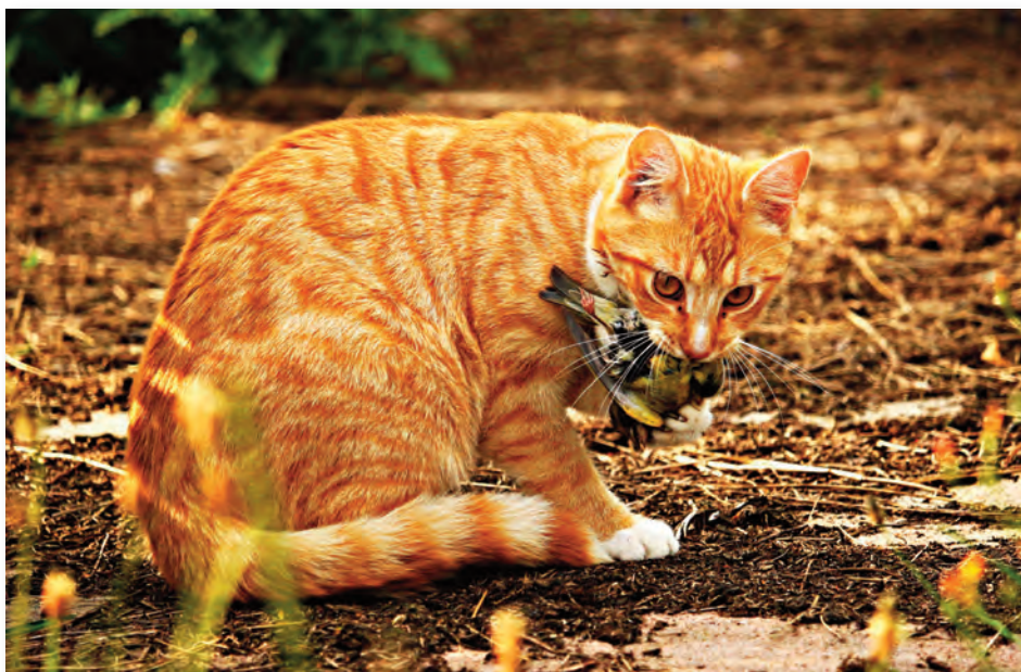
Wirklich hungrig sieht die gepflegte Katze nicht aus.

So oder sehr ähnlich spielt es sich Jahr für Jahr in zahllosen deutschen Gärten oder anderenorts in der heimischen Natur ab. Die schleichenden Jäger sind natürlich nicht immer nur Katzen, denn auch andere Säugetiere machen Jagd auf Vögel. Aber die Hauskatzen sind diejenigen Jäger, die die meisten jungen Vögel töten. Vor allem die Jungtiere von Vogelarten, die in Hecken oder auf dem Boden brüten, werden von Hauskatzen und anderen Fressfeinden erbeutet. Aber auch viele Jungtiere in Bäumen brütender Vogelarten erreichen das Erwachsenenalter nicht, weil ihr Nest von Hauskatzen kletternd erreicht werden konnte. Sogar Nistkästen sind oft nicht vor Angriffen durch Hauskatzen sicher. Gerade flügge gewor-