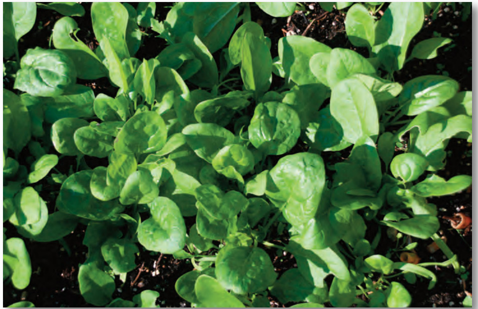
Spinat füllt schnell die freigewordenen Beete, schützt somit den Boden vor Erosion und wächst sogar bei herbstlichem Wetter. Er kann bis zum nächsten Frühjahr beerntet werden.

In diesen Tagen ist letzte Gelegenheit für den Sommerschnitt an Obstbäumen. Fallobst regelmäßig aufsammeln und wenn möglich verwerten. Kartoffeln an warmen, sonnigen Tagen vorsichtig aus der Erde heben. Erntereif sind sie, wenn sie geblüht haben und das Laub vergilbt ist. Es bringt nichts, sie dann noch länger in der Erde zu belassen. Die Schale wird rauer und dicker und neugierige Mäuse probieren, ob sie als Wintervorrat taugen. Abgeräumte Gemüsebeete für die spätere Ernte im Herbst mit Kohlrabi, Kohl, Fenchel, Lauch, Radicchio, Mangold und Rote Bete neu bepflanzen. Gut sortierte Gartencenter bieten jetzt noch Jungpflanzen in großer Auswahl an. Vorher etwas Kompost einarbeiten. Spinat, Feldsalat, Rucola, Radieschen und Asia Salate direkt ins Beet säen, gut feucht halten – so keimen sie schnell und zuverlässig – und sind in wenigen Wochen erntereif. Frischer Knoblauch aus dem eigenen Garten ist eine ganz besondere Delikatesse und denkbar einfach anzubauen: Dafür eine Knolle in ein-