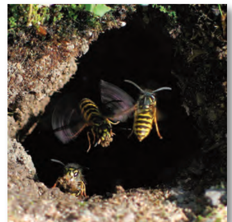
Arbeiterinnen der Gemeinen Wespe am Nesteingang ihres Erdnestes.

lung nach einem Stich ist jedoch keine Allergie, sondern eine normale körperliche Reaktion. Bei Problemen mit der Lage eines Nestes kann man eine sachkundige Person, die man zum Beispiel über das städtische Umweltamt oder den örtlichen Imkerverein erreicht, mit einbinden. Vor Ort können Maßnahmen ergriffen werden, um zum Beispiel den Eingang durch ein Rohr schrittweise in eine andere Ecke zu verlegen. Auch eine Umsiedlung kann erfolgen. Im Bereich von Erdnestern sollte man sich nicht aufhalten und auch keinen Rasen mähen, weil die erzeugten Vibrationen die Wespen reizen. Bei Eingriffen in ein Hornissenvolk muss immer das Umweltamt informiert werden, da Hornissen unter besonderem Schutz stehen. Letztlich sollte das Abtöten des Nestes immer nur die letzte Option sein.