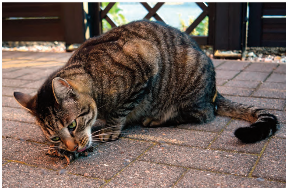
Auch diese Hauskatze muss nicht jagen, um zu überleben.