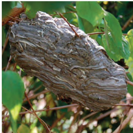
Freihängendes Nest der Mittleren Wespe.

Lästig werden die beiden oben benannten Wespenarten vor allem ab dem Spätsommer, während sie davor meist wenig auffällig sind. Dies liegt daran, dass sie auf zuckerhaltige Nahrung angewiesen sind, die während der Brutzeit von den Larven als