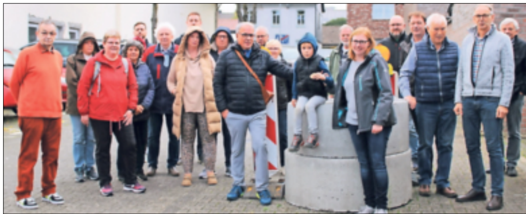
Baustellen-Charakter haben die Betonschachtringe aktuell noch.