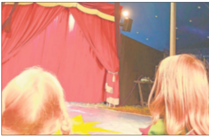
Das Highlight des Zirkus-Projekts waren die beiden Gala-Aufführungen.