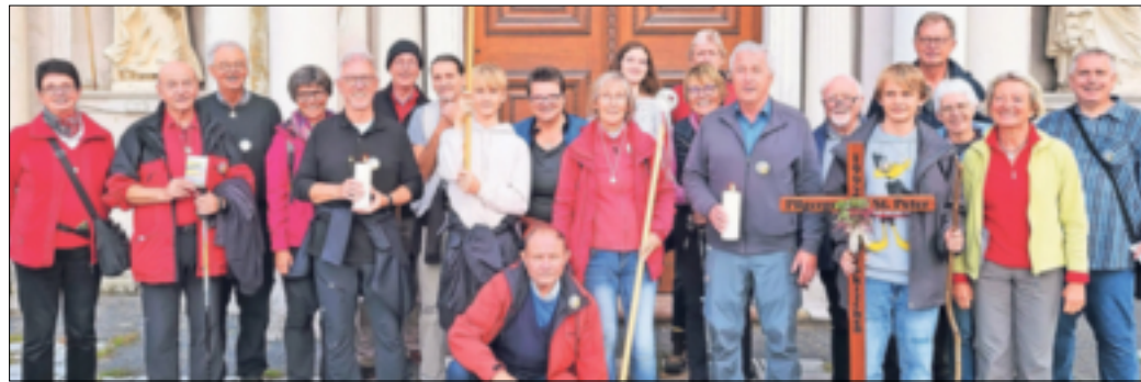
Die Rommerskirchener Matthiaspilger waren zum 30. Mal auf Wallfahrt nach Trier.