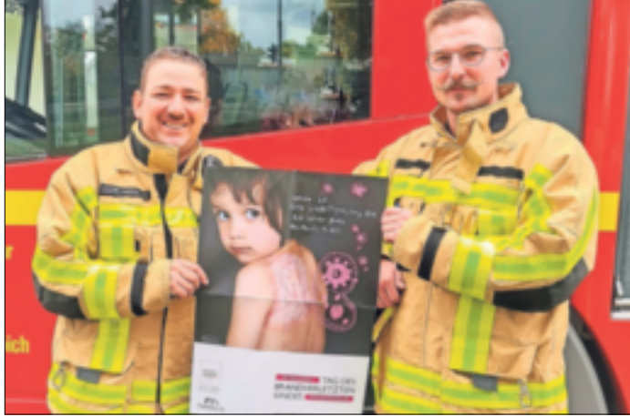
Schon jetzt gibt es bei den Florianern den einen oder anderen Schnäuzer zu sehen. Für den guten Zweck sollen es im November noch mehr werden.

Grevenbroich. Wer im November auf haupt- und ehrenamtliche Feuerwehrleute aus Grevenbroich trifft, dem dürfte ein neuer Look im Gesicht der Einsatzkräfte kaum verborgen bleiben. Viele der rund 250 Florianer wollen sich 30 Tage lang einen Schnauzbart stehen lassen. Ziel der Aktion „NovemBart“: Aufmerksamkeit erregen und Spenden für brandverletzte Kinder sammeln. Der Trend zum Schnauzbart im November nimmt schon seit einigen Jahren stetig zu. In der Regel wollen die Barträger beim „Movember“ für männertypische Krebserkrankungen sensibilisieren und Spenden sammeln. Das Ziel der Sensibilisierung verfolgen auch die Wehrleute aus der Schlossstadt. Dennoch steht für sie thematisch ein anderes Spendenziel im Mittelpunkt. Die Feuerwehrleute wollen Geld für die Stiftung „Paulinchen“ sammeln. Die Initiative unterstützt seit 1993 Familien und deren Kinder nach Verbrennungs- oder Verbrühungsunfällen. Jedes Jahr sind allein in Deutschland rund 30.000 Kinder unter 15 Jahren von Verbrennungs- oder Verbrühungsunfällen betroffen. Am 7. Dezember findet der „Tag des brandverletzten Kindes statt“. Das bis dahin gesammelte Geld wollen die Grevenbroicher Florianer dann als Spende an die „Paulinchen“-Stiftung übergeben. Initiator der Grevenbroicher