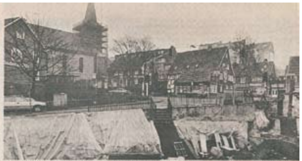
Brandstiftung, Abbruch, Neubauplanung. Jetzt wurde an der Spitzenstraße am Langerfeldes Markt eine 250 Jahre alte Wasserleitung entdeckt.