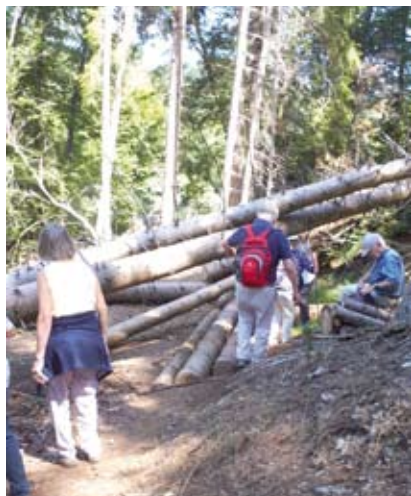
Friedrich Affüpper und Bernd Schönebeck

Fazit: Wozu sind doch Senior*innen noch alles fähig!