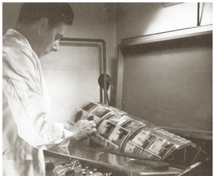
Bei der Spurensuche halfen damals moderne Mikroskope und Entwicklungsmaschinen für Farbfotografie.