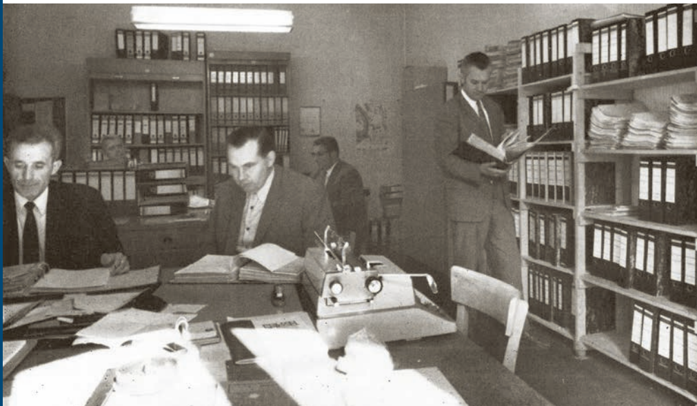
Kriminalistische Fantasie war gefragt, ob nun gegen Wirtschaftskriminelle oder Wilderer.

Bei den Geldfälschern gibt es Entwarnung. „DM-Blüten kaum zu fabrizieren“, vermeldet eine Zwischenüberschrift erleichtert. Aber die Rauschgiftdelikte nähmen zu. Dabei seien sie noch vor einigen Jahren „kriminelle Randerscheinungen“ gewesen, „die sich in Verstö-