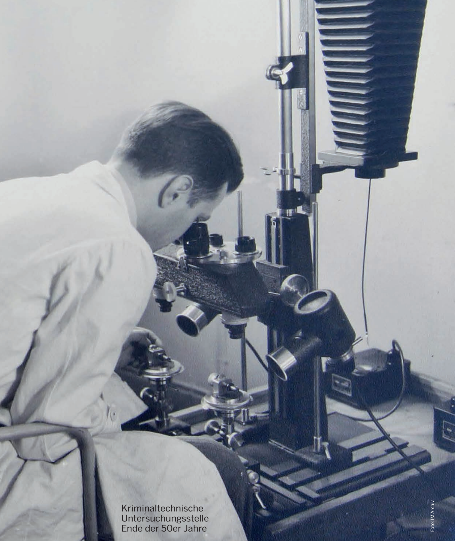
Kriminaltechnische Untersuchungsstelle Ende der 50er Jahre