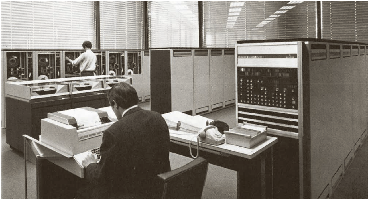
Eine Großrechenanlage im LKA kündigte eine neue Epoche an.

trug, Wirtschaftskriminalität, Falschgeld- und Rauschgiftdelikte“. Die Bekämpfung von Wirtschaftsverbrechen steht im Vordergrund. Eine Aufnahme zeigt vier gesetzte Männer im Anzug. Sie gehören zu einer Kommission, die in einem „umfangreichen Verfahren“ ermittelt. Die Bildzeile hebt das „Aktenmaterial“ mit Dutzenden von Ordnern in den Regalen hervor. Auf dem Tisch steht eine Schreibmaschine.