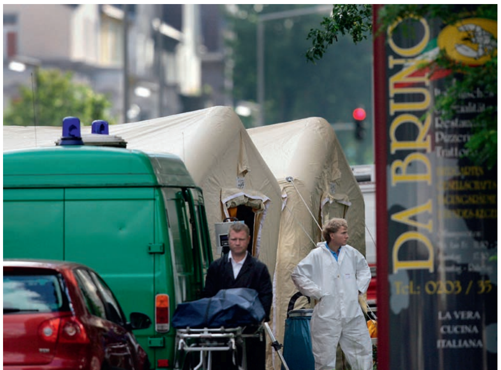
Die Mafiamorde von Duisburg mit sechs Opfern schockierten das ganze Land.

Die Telefonüberwachung war einst sehr kompliziert. „Nach einer TÜ-Genehmigung wurde die Aufschalttechnik bei der Post abgeholt“, erzählt Jungbluth. Mit Revox-Tonbändern habe man dann die Gespräche – etwa im Rahmen eines Rauschgiftverfahrens – mitge-