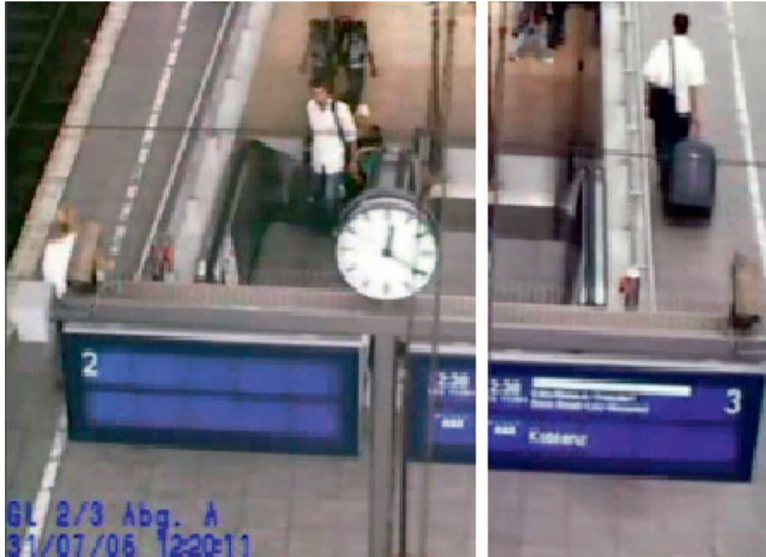
Eine Überwachungskamera filmte am 31. Juli 2006 einen Kofferbomber im Kölner Hauptbahnhof. Der Versuch der Täter, Bomben in zwei Regionalzügen zu zünden, scheiterte.

Kriminalität“ in der Abteilung 6 (Staatsschutz und Ermittlungsunterstützung).