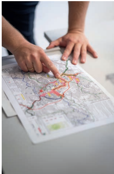
Viele Auto- und Lkw-Fahrer suchen sich Ausweichrouten und Abkürzungen, um den allgegenwärtigen Staus zu entgehen.