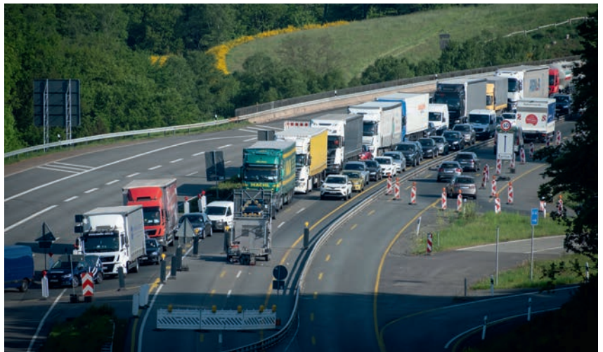
Jeden Tag bilden sich in beide Richtungen kilometerlange Staus vor den gesperrten Ausfahrten.