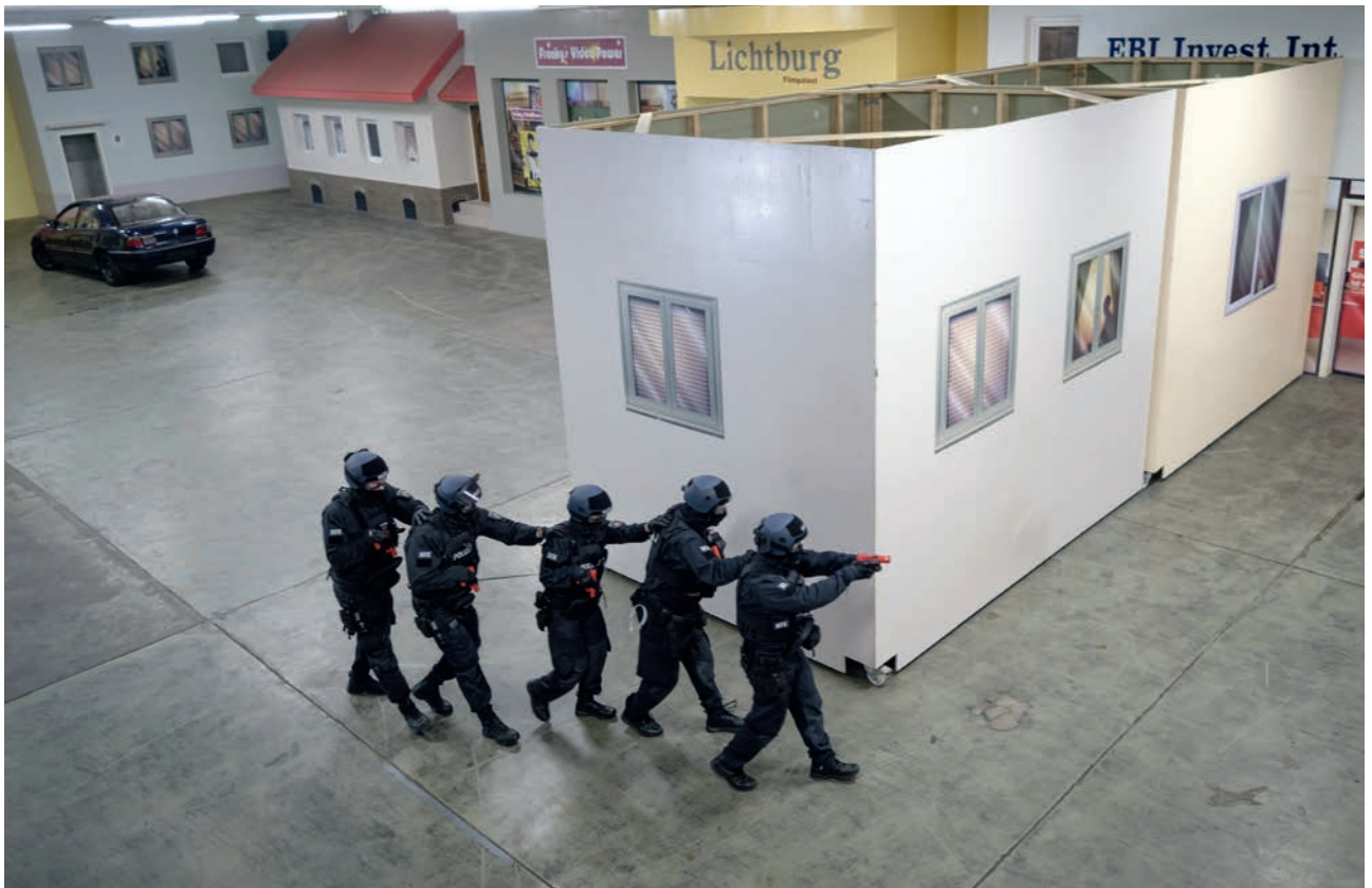
Kein Ersatz: Die VR-Technologie soll Realwelt-Training keinesfalls ersetzen. Sie ist aber eine effektive und effiziente Erweiterung.

könnte man den Probanden einen Schmerzimpuls mit einem kurzen Stromstoß geben, wenn sie getroffen worden sind“, berichtet Uhl. Das würde sich etwa so anfühlen wie ein Insektenstich. Damit verstärkte sich die Bedrohlichkeit der Situation. „Wir haben auch ein Verfahren entwickelt, mit dem unangenehme Gerüche – Fäkalien, Rauch oder Benzin – in die Abläufe eingespeist werden können.“