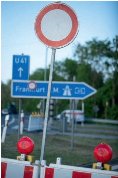
Noch ist völlig unklar, wie lange die Anwohner mit der Sperrung und ihren Konsequenzen leben müssen.