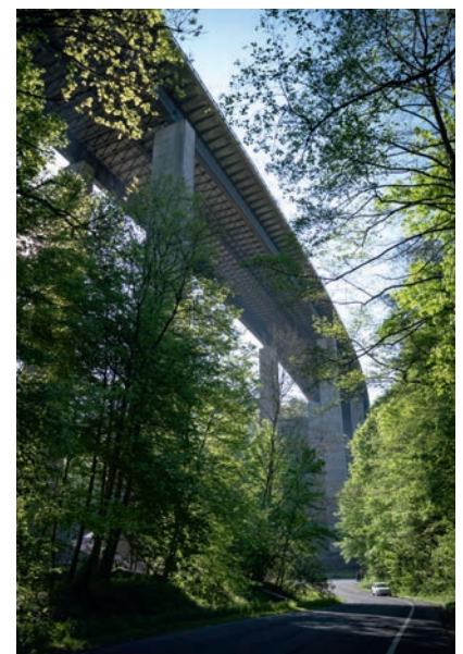
Die Sprengung der gesperrten Brücke ist noch für dieses Jahr geplant.