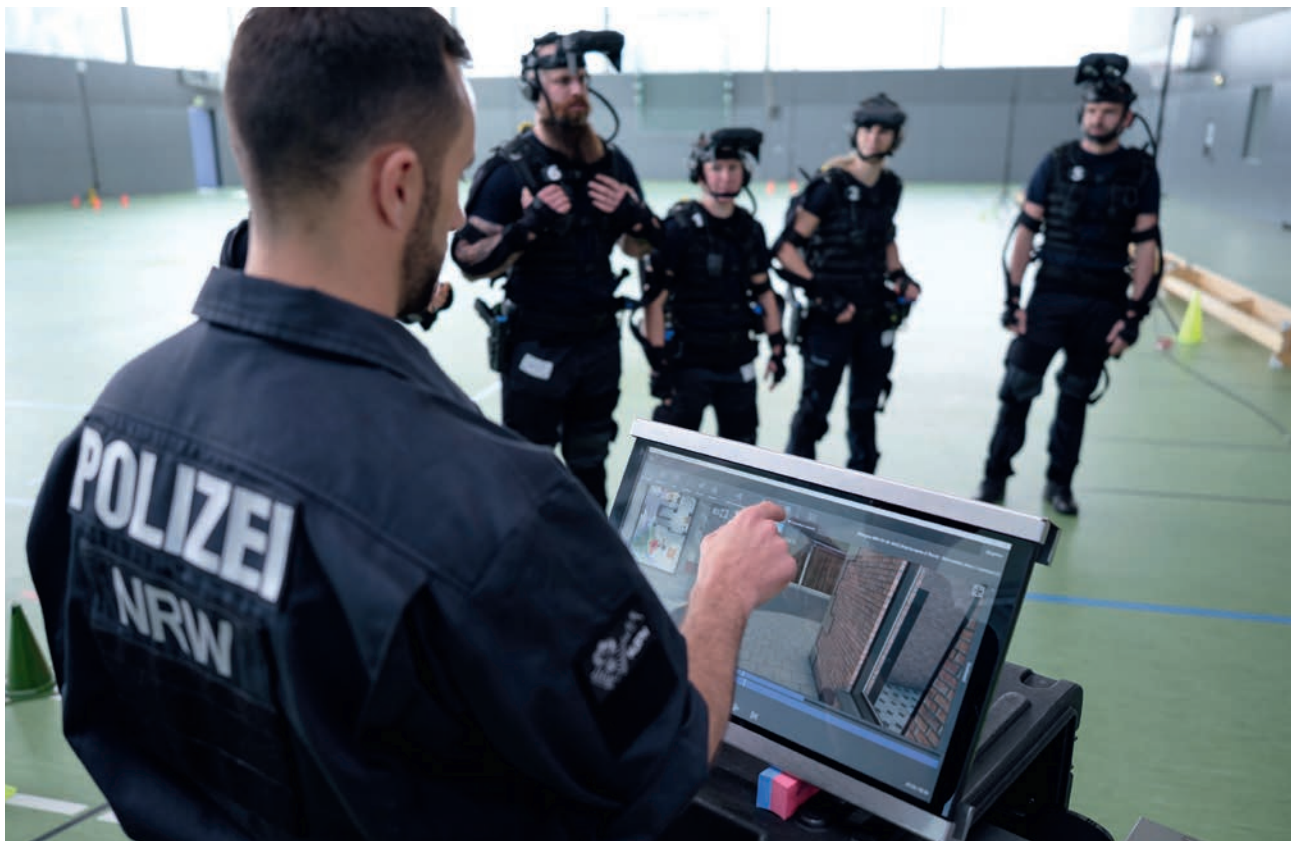
Effizienz: Das After-Action-Review ermöglicht, die Kommunikation, die Waffenhaltung und die Laufwege nachzubereiten.

wird er sofort getroffen. Weitere Schüsse fallen. „Keine Bewegung oder ich schieße“, ruft jemand erregt in die Halle. Ein anderer fällt auf die Knie. Dann ist erst einmal