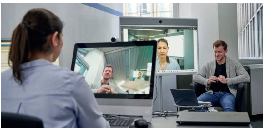
Im Düsseldorfer Polizeipräsidium wird die Online-Vernehmung schon erprobt.

Und so funktioniert die Online-Vernehmung: