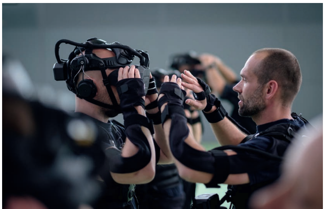
Kalibrierung: Die Sensoren am Körper und die VR-Brille müssen zu Beginn des Trainings individuell eingestellt werden.

Vieles lasse sich noch in die VR-Prozesse integrieren. „Zum Beispiel