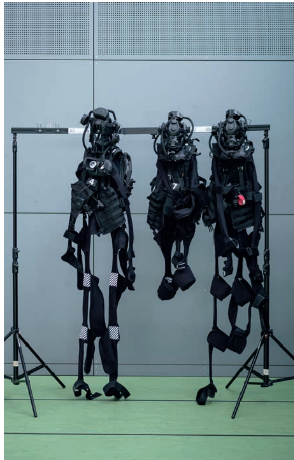
Prototypen: Sensortechnologie und Hardware, die am Körper der Teilnehmer getragen werden

Bis zum Ende des Projekts im November soll dazu von internatio-