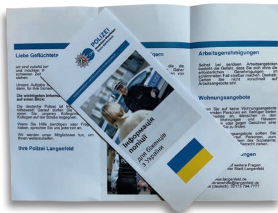
Die Flyer der Polizei Münster wurden regional angepasst.

In den ursprünglich vom Polizeipräsidium Münster entworfenen Flugblättern (siehe Streife 02/2022), die mit den regionalen Kontaktdaten angepasst wurden, wird unter anderem vor unseriösen Wohnungs- und Arbeitsangeboten gewarnt und die Herausforderung bei der Erlangung einer Arbeitsgenehmigung hingewiesen.