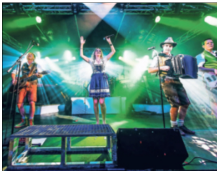
Die „Albfetza“ treten beim Oktoberfest auf und wollen wieder einmal das Publikum mitreißen!

Gierath/Gubberath. Für die passende Stimmung beim Oktoberfest werden die „Albfetza“ sorgen – und der Name ist Programm. Denn dass die Band einheizen kann, davon durften sich die Gierather, Gubberather und ihre Gäste bereits überzeugen. Seit über 20 Jahren sind die „Albfetza“ europaweit auf Tour und begeistern ein breit gefächertes Publikum in allen Altersklassen. Wenn einer der Musiker eine Idee hat, spinnen sie alle zusammen solange durch, bis daraus ein „Partytauglicher-Fetza-Kracher“ im typischen „Albfetza-Sound“ wird.“ Gespielt wird alles was den Musikern in die Hände fällt, von der zünftigen Mosch Polka über die Gipsy Kings, von Helene Fischer und Anderas Gabalier bis zu AC/DC und das alles im originalen „Albfetza-Sound“: „Da wird schon mal `ne Stromgitarre