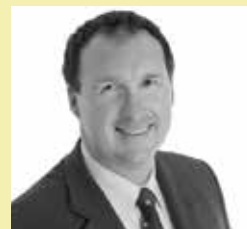
Stefan Janz Sonder- und Gewerbeim- mobilien