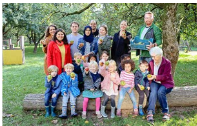
Ein pädagogisches Projekt, bei dem drei Generationen miteinander und voneinander lernen.

die noch bis Jahresende die Bedeutung sozialer Berufe betonen. Ziel ist es, eine gesellschaftliche Anerkennung und bessere Arbeitsbedingungen zu erreichen. Mehr Informationen unter www.takecare-aktionswoche.de