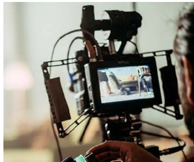
Unter www.kaiserswerther-diakonie.de/jahresfest erleben Sie die Kaiserswerther Diakonie aus einer ganz anderen Perspektive.

Bereits 2017 wurde die Klinik für Thoraxchirurgie gemeinsam mit der Klinik für Pneumologie als erstes Lungenkrebszentrum in Düsseldorf von der Deutschen Krebsgesellschaft (DKG) zertifiziert. Diese Auszeichnung bescheinigt die hohen Standards bei der medizinischen Behandlung und Pflege von Lungenkrebspatient:innen.