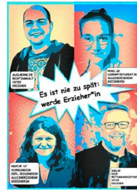
Mit Plakaten im Pop-Art-Stil machen die Studierenden auf die Bedeutung sozialer Berufe aufmerksam.