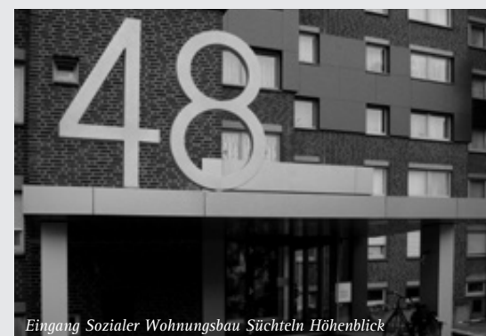
Eingang Sozialer Wohnungsbau Süchteln Höhenblick