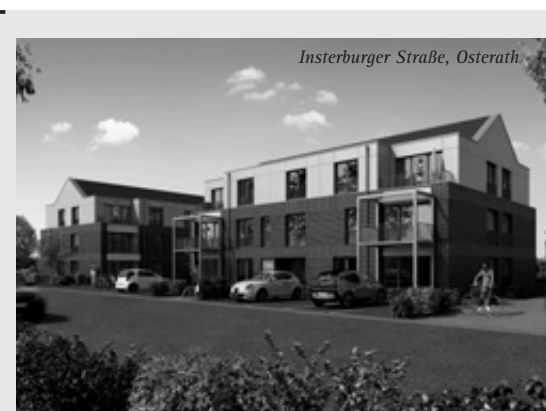
Insterburger Straße, Osterath