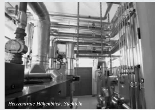
Heizzentrale Höhenblick, Süchteln