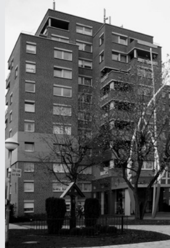
Sozialer Wohnungsbau Süchteln Höhenblick

Die Rahmenbedingungen für preiswerten Wohnraum sind also schwierig und durch die besondere