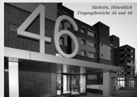
Süchteln, Höhenblick Eingangsbereiche 46 und 48

Ziel der Sanierung war es, die Heizkosten aus Mietersicht um 1,80 Euro je qm und Monat zu reduzieren. Mieter einer 80-qm-Wohnung werden somit 1.728 Euro in einer Heizperiode einsparen können.