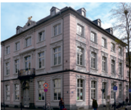
Floh'sche Haus, Friedrichstraße