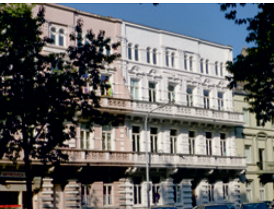
Ensemble am Südwall