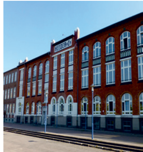
Denkmalgeschützt: Fabrik Heeder