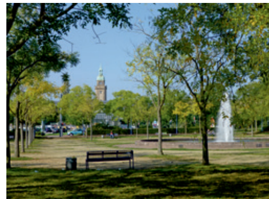
Platz der Wiedervereinigung