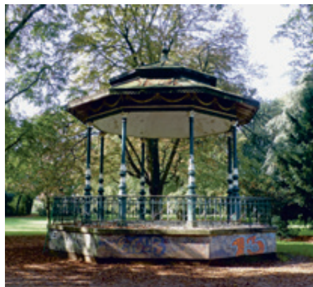
Pavillon im Stadtgarten