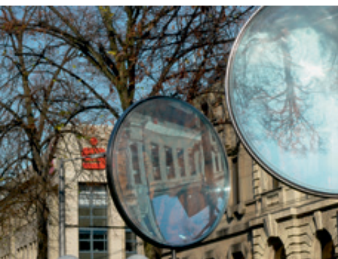
Luther-Linsen am Ostwall

von der Leyen und de Greiff. Ein Spezialgebiet der Seidenweberei war die renommierte und lange europaweit führende Krawattenherstellung. Wer weiß heute noch, dass das Pariser Luxus-Modelabel Hermès Krefelder Wurzeln hat? Thierry Hermes, von allen nur Dietrich gerufen, 1801 zur Franzosenzeit in Krefeld geboren und Sohn eines Wirtes von der Königstraße, wanderte 1828 nach Frankreich aus und ließ sich an der Peripherie von Paris nieder, wo der gelernte Sattler die Firma Hermès begründete.