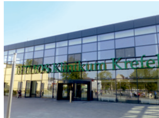
Helios Klinikum Krefeld