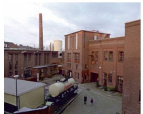
Ehemalige Weinbrandbrennerei Dujardin, Uerdingen

Besserung ist jedoch in Sicht. Die Samt- und Seidenstadt erfindet sich gerade neu. Nach vielen Jahren der Stagnation ist die Innenstadt derzeit eine einzige Baustelle. Der zentrale Bus- und Bahnknotenpunkt am Ostwall ist großzügig umgebaut worden und erhält in den nächsten Monaten eine Glasüberdachung, über deren Sinn oder Unsinn der Krefelder immer noch gerne streitet.