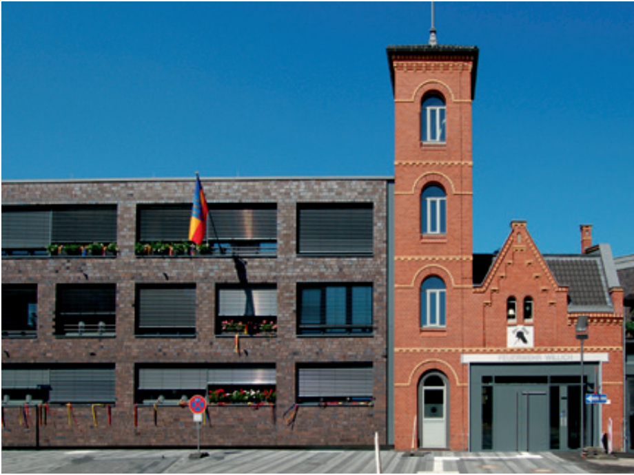
Wohnanlage „Kaiserplatz“ heute anstelle des alten Feuerwehrgerätehauses. Der Steigerturm ist denkmalgeschützt und wurde integriert.