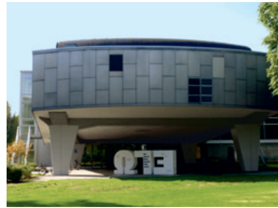
Pfau-Haus – Hochschule Niederrhein