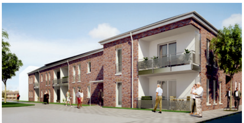
Projekt: St. Hubert, Hauptstraße 29, 47906 Kempen; Entwurfsverfasser: Dipl.-Ing. Udo Thelen, Architekt