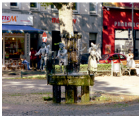
Puppen-Brunnen am Südwall