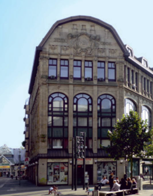
Historisches Sinn-Haus, Neusser Straße