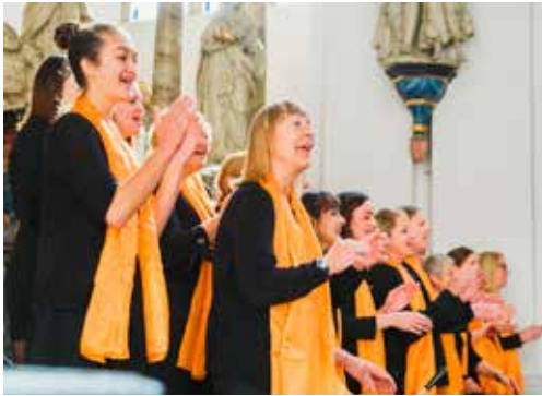
Der Gospelchor Voices of Joy macht mit bei den Aktionswochen „Offene Chorprobe“.

Zehn Chöre des Chorverbandes Düsseldorf beteiligen sich an den Aktionswochen „Offene Chorprobe“ im August und September 2022. Reinschnuppern ausdrücklich erwünscht!