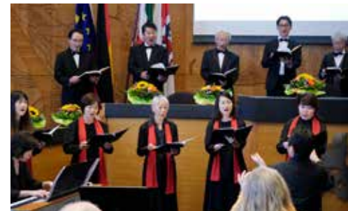
Japanischer Männerchor und Sakura-Chor bei der Jubilarehrung am 19. September 2021.

am 19. September 2021 war es dann soweit. In Anwesenheit des Japanischen