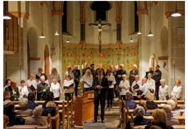
Madrigalchor Millrath beim Benefizkonzert 2021 in Alt-Erkrath.

Zuversichtlich, das Adventskonzert im Dezember singen zu können, begaben sich die Sängerinnen und Sänger Anfang November zum traditionellen Probenwochenende ins Sauerland. Leider stiegen die Infektionszahlen im letzten Herbst immens, daher meldeten sich immer mehr Chormitglieder in den kommenden Wochen von den Proben ab. Der Madrigalchor Millrath war nicht mehr singefähig, sodass das vorweihnachtliche Konzert schweren Herzens abgesagt werden musste. Ein Schicksal,