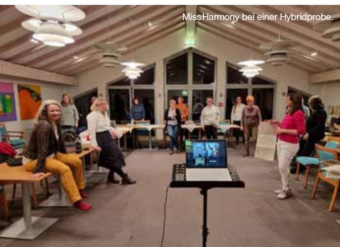
Miss Harmony bei einer Hybridprobe.

Im Moment spielt sich das Konzertleben eher draußen ab, Highlight in diesem Frühjahr war die Teilnahme am Barbershop-Festival in Dordrecht/NL (siehe Bericht auf Seite 21), und im Herbst bilden wir uns – gemeinsam mit anderen Chören – weiter beim „BING! (Barbershop in Germany) Harmony College“ in Oberwesel, das nach zweijähriger Pause wieder live stattfinden wird. //