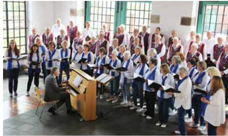
Frauenchor Hochdahl und Hochdahler MGV 1909

Das Lampenfieber ist deshalb etwas stärker zu fühlen als sonst. Wird unser Publikum sich ebenso freuen und