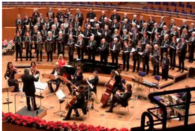
Polizei-Chor Düsseldorf 1958 beim Konzert in der Tonhalle Düsseldorf.

Im Juli war es dann möglich, unter Einhaltung aller Coronaregeln, sich einmal persönlich zu treffen, auch ohne Gesang. Die Einladung in den Biergarten eines Kleingartenvereins wurde sehr begrüßt.