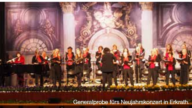
Generalprobe fürs Neujahrskonzert in Erkrath.

Im Mai folgte dann für einen Teil des Frauenchors Erkrath 1997, der in diesem Jahr sein 25-jähriges Bestehen feiert, gleich ein weiteres Highlight. Der Projektchor „Coral Renania“ traf am 14. Mai 22 seinen Partnerchor in dem französischen Städtchen Cergy-Pontoise. In der Eglise Ozanam kam mit einem insgesamt 80-köpfigen Chor, Orchester und vier Solisten das „Requiem“ von Mozart zur Aufführung. Ein sehr emotionales Ereignis, denn das Konzert stand auch im Zeichen des Krieges in der Ukraine. Zu Beginn erklang in der vollen Kirche von den Chören und dem Orchester die Nationalhymne der Ukraine – im Anschluss dann das Requiem. Beeindruckend! //