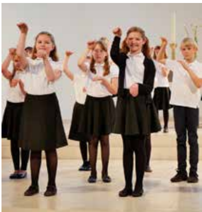
Kinderchor der Akademie für Chor und Musiktheater beim Sommerkonzert 2022.

Überhaupt will der Madrigalchor Millrath positiv in die Zukunft schauen und probt unter nicht einfachen Bedingungen im Bürgerhaus Hochdahl weiter. Vielleicht gibt es ja in absehbarer Zeit mal wieder ein richtiges Konzert. Wer weiß? //