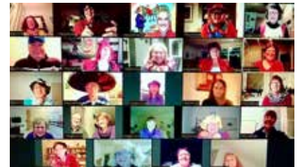
Rejoice! bei einer Chorprobe via Zoom.