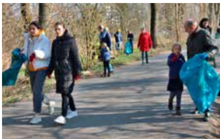
Helfer bewaffnet mit Zangen, Handschuhen und Mülltüten

Auf Initiative des Allgemeinen Bürgervereins Urdenbach und des Bürgervereins Baumberg haben Freiwillige auch in diesem Frühjahr traditionell die Urdenbacher Kämpfe von Abfall und Müll befreit.