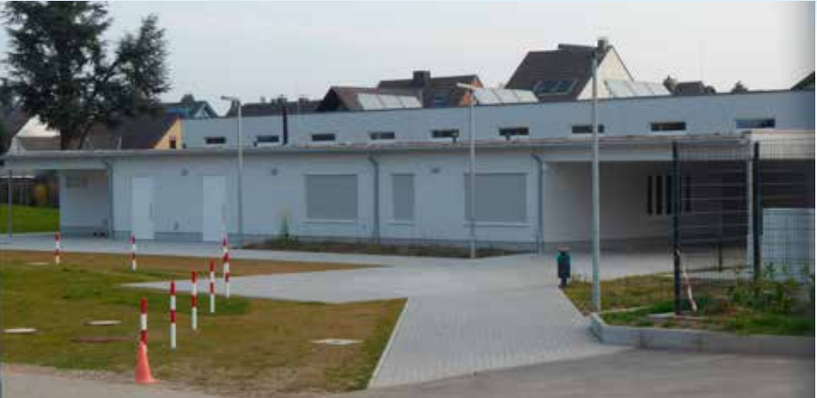
Das neue Friedhelm Gutowski-Haus