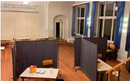
Gemeindesaal umgebaut als Impfzentrum Urdenbach