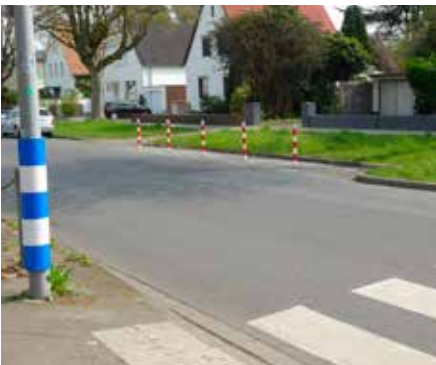
Neue Poller auf der Südallee garantieren freie Sicht auf Kinder vorm Zebrastreifen.

Eine weitere Verbesserung im Bereich Mühlenplatz erwarten die Politiker, wenn der Baumberger Weg wie beantragt auch noch Tempo 30-Strecke wird. Welski: „Das ist dort schon wegen der Fußgängerströme zwischen Piels Loch und Ortweg nötig.“