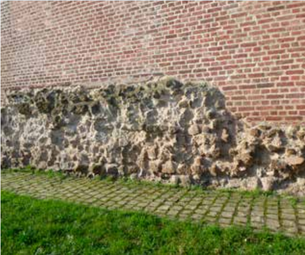
Original römisches Mauerwerk