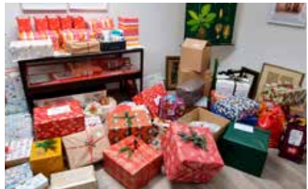
Die Weihnachtspakete wurden in der Geschäftsstelle abgegeben.

Im Dezember hatte der ABVU aufgerufen, Geschenkpakete für bedürftige Urdenbacher Familien zu packen und in der Geschäftsstelle abzugeben.