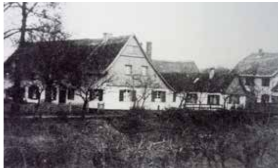
Blick auf das alte Firmengelände

die Handtöpfereien nicht mehr konkurrenzfähig und mussten schließen. Die alten Brenngruben (Gruben in der Erde), die nach dem Lufttrocknen der Töpferware mit diesen gefüllt wurden, waren bis Ende der 1950er Jahre noch auf dem Gelände der Firma Hansen zu sehen. Ebenso stand die alte Trockenhalle noch lange, bis sie einem Neubau der Fa. Hansen weichen musste.