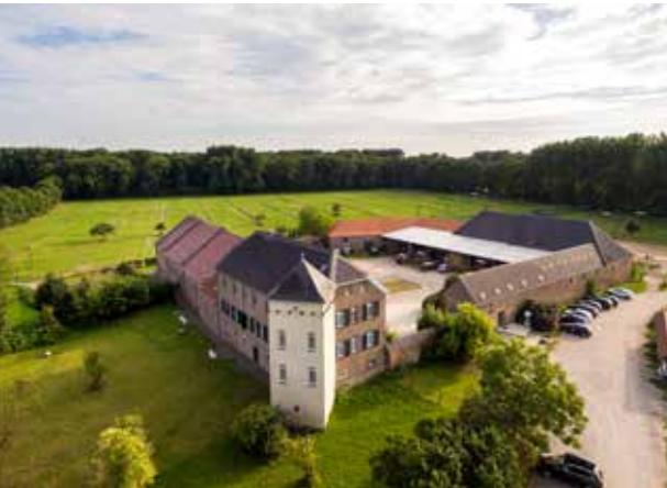
Luftaufnahme Haus Bürgel - Römische Geschichte, Naturschutz und Kaltblutpferde

Am 27. Juni 2021 war der Hammer Schlag, der Haus Bürgel zum Weltkulturerbe machte. An diesem Tag erfolgte die Welterbe-Anerkennung des Niedergermanischen (des „nassen“) Limes, zu dem Haus Bürgel gehört. Mit den übrigen insgesamt 44 Fundstätten verständigte man sich auf den 30. Juni 2021 als gemeinsamen Geburstermin. Kurz vor dem ersten Geburtstag fragten wir nach, was das Weltkulturerbe bedeutet und was sich seitdem verändert hat.