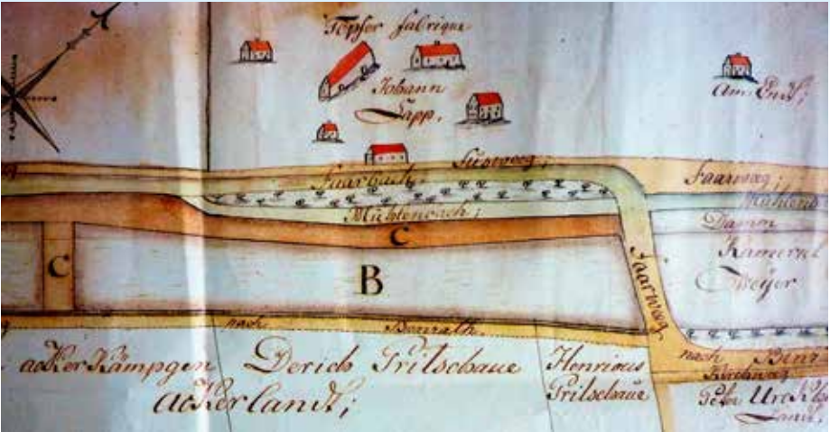
Auszug aus Karte Nr.3 mit der Töpferfabrik Johann Lapp