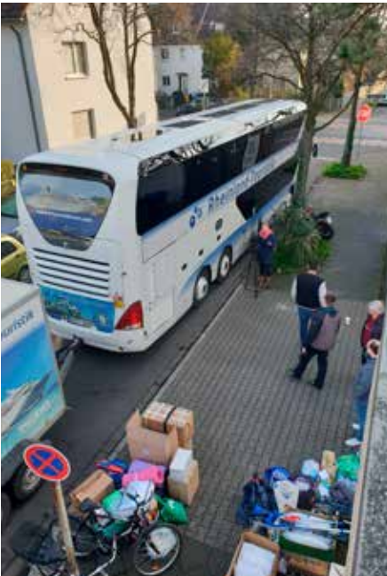
Doppeldecker vor der Fahrt in die Ukraine