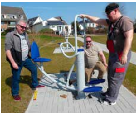
Fleißige Helfer beim Aufbau des Gym-Parks

Mit der Erneuerung seiner Infrastruktur startete der TSV aber auch inhaltlich ganz neu durch. Wallscheid: „Wir haben uns die Frage gestellt, welche neuen Anforderungen es heutzutage