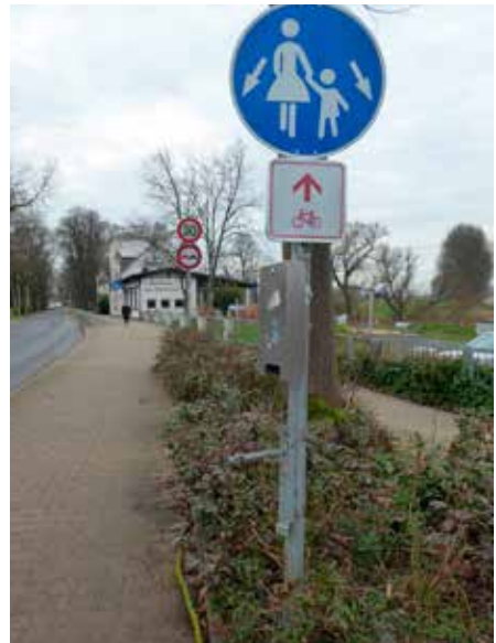
Die Beschilderung am Benrather Schlossufer soll durch Piktogramme ergänzt werden.