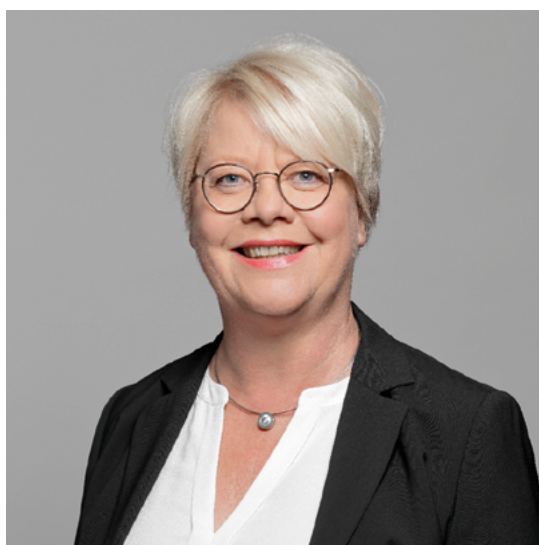
Astrid Neese Beigeordnete für Bildung, Arbeit und Soziales