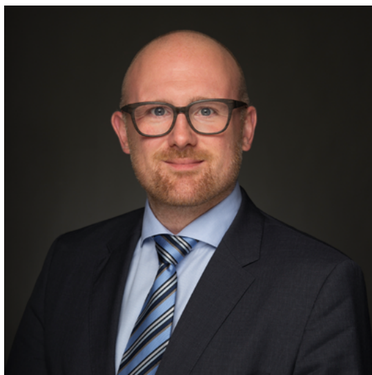
Sören Link Oberbürgermeister der Stadt Duisburg