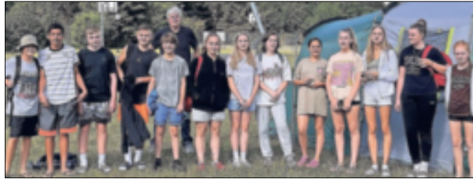
Auf einem Zeltplatz verbrachten die jungen Basketballer ein erholsames Wochenende.