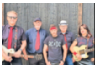
Ein Wiedersehen mit „Secret Flame“.