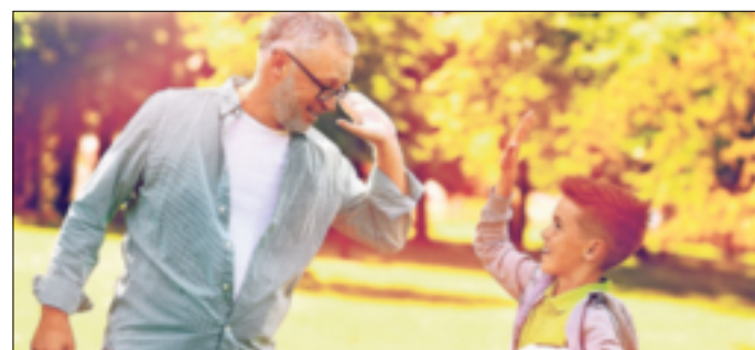
Wer sich gesund ernährt, bleibt im Alter noch fit.

Grevenbroich. Volksleiden Rückenschmerzen: Jeder fünfte gesetzlich Versicherte geht mindestens einmal im Jahr deswegen zum Arzt, 27 Prozent davon sogar viermal oder häufiger. Jährlich sind das somit über 38 Millionen Arztbesuche aufgrund von Rückenschmerzen. Das gab die Techniker Krankenkasse bekannt. Durch ausreichend Bewegung, Entspannung und eine gute Ernährung können Menschen die Rückenmuskulatur stärken und ihre Rückengesundheit insgesamt unterstützen. Rückenprobleme und andere Beschwerden im Bewegungsapparat entstehen heute selten durch körperliche Überlastung, sondern eher durch Bewegungs-