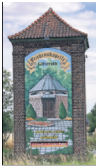
Bild und Mahnspruch auf der Gilverather Trafo-Station, die heute den „Flotte Boschte“ gehört.

„Wir sind keine Helden, sondern wir wollen nur versuchen, uns für den Frieden einzusetzen“, betont Günter Pesch. Und deshalb fordert derzeit die Gilverather Friedenskapelle, unterstützt von 200 LEDs: „Gib endlich Frieden, Putin“.