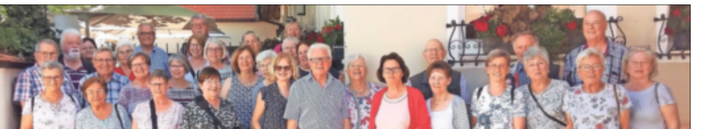
Die Gartenfreunde aus Gindorf und Gustorf waren jetzt zu Besuch in Regensburg.