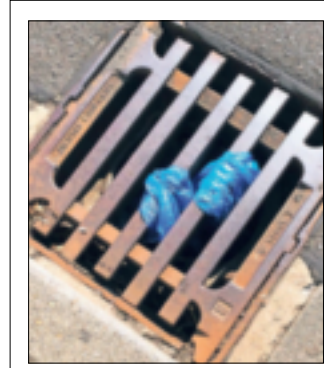
Der Gully mit der müffeln- den Befüllung.