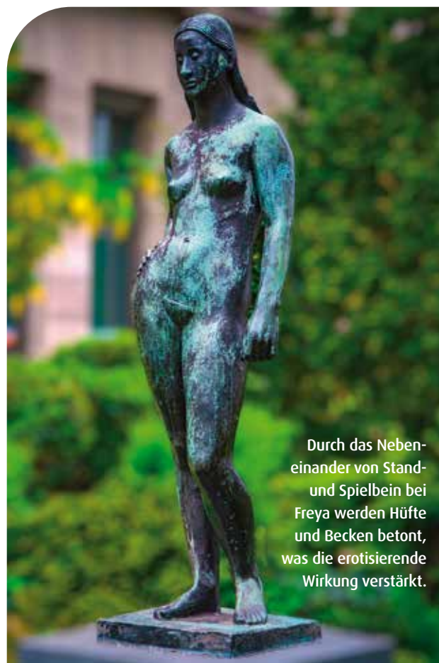
Durch das Nebeneinander von Stand- und Spielbein bei Freya werden Hüfte und Becken betont, was die erotisierende Wirkung verstärkt.

im Französischen steht „Nana“ für moderne, selbstbewusste, erotische und auch verruchte Frauen. Niki de Saint Phalle sah