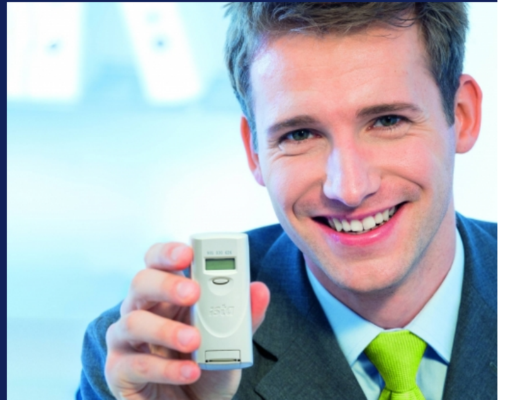
Heizkostenverteiler doprimo 3 ready