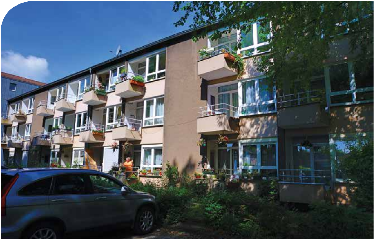
Der Wohnblock, bestehend aus zwei Häusern, überzeugt mit Balkonen für jede Wohnung.

Auf der Goethestraße hätte es dem Dichter auch gefallen