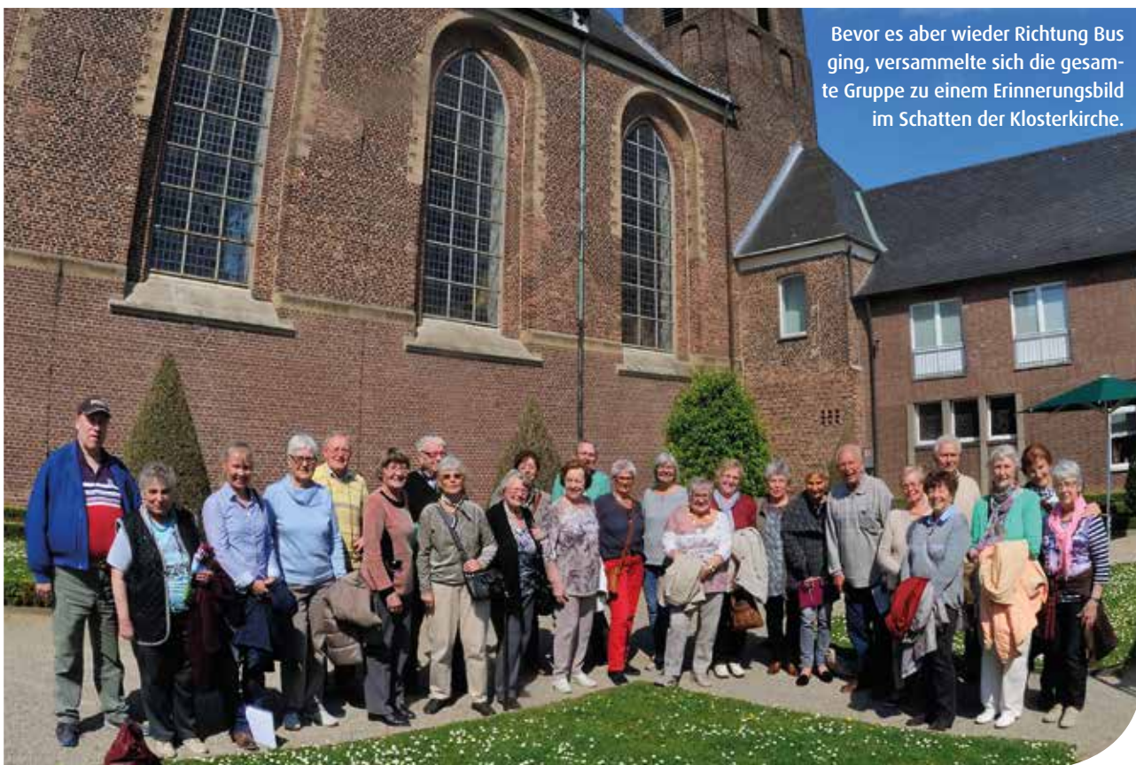
Bevor es aber wieder Richtung Bus ging, versammelte sich die gesamte Gruppe zu einem Erinnerungsbild im Schatten der Klosterkirche.

Alle waren sich wieder einmal einig, dass auch die nächste Fahrt der WOG Ruhrgebiet nicht verpasst werden sollte: Dann geht es nach Bad Sassendorf.