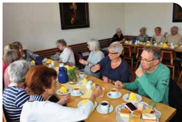
Die leckere Kaffee-Tafel bildete schon fast den Abschluss des Reiseprogramms.