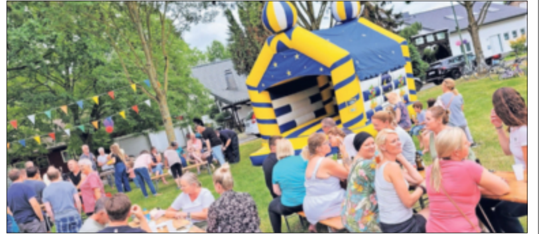
Nach zwei Pandemie Jahren war es nun bereits das dritte Spielplatzfest an Ort und Stelle und hat sich damit fest im örtlichen Veranstaltungskalender etabliert.