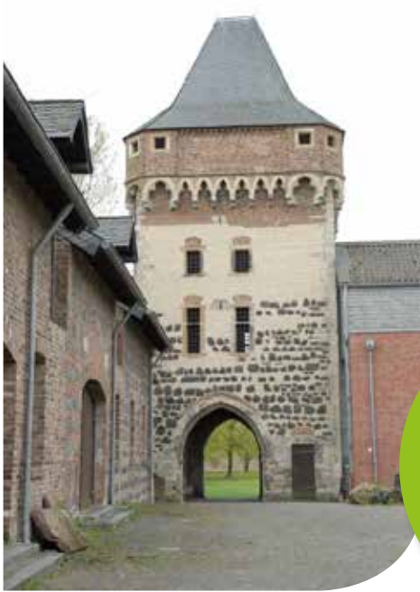
Panorama des Innenhofs mit Torturm.