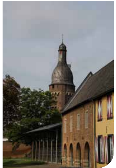
Blick von den Burghöfen; Im Hintergrund der Juddeturm.