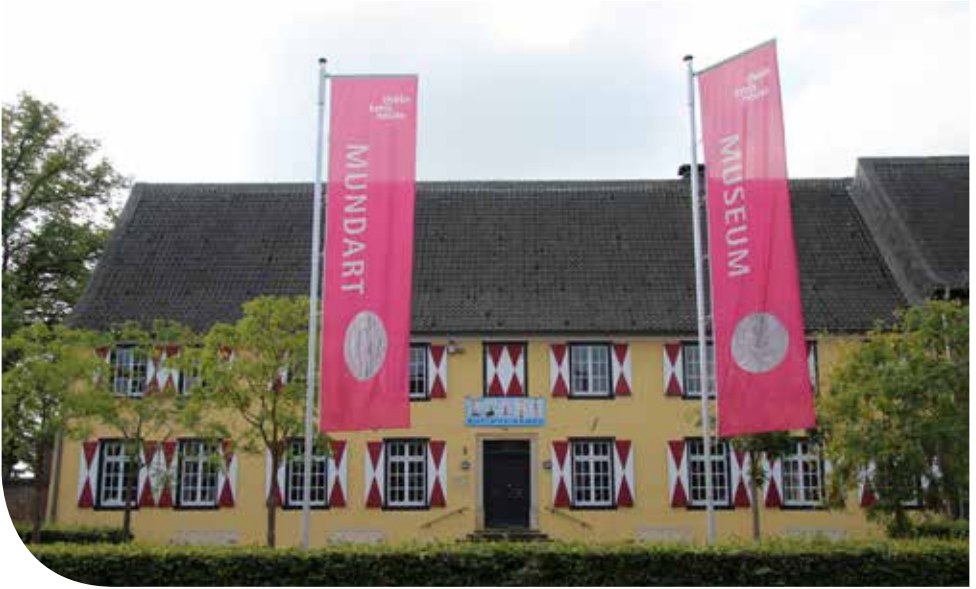
Das Kreismuseum aus Richtung Schloßstraße.