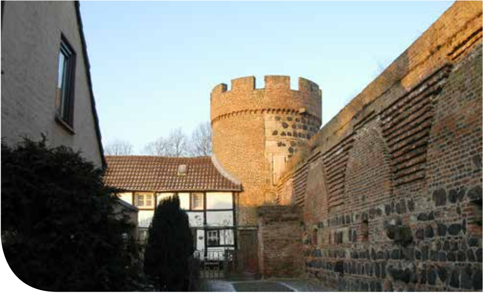
Stadtmauer mit Krötschenturm.