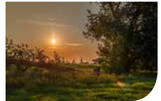
Rheinauen im August.