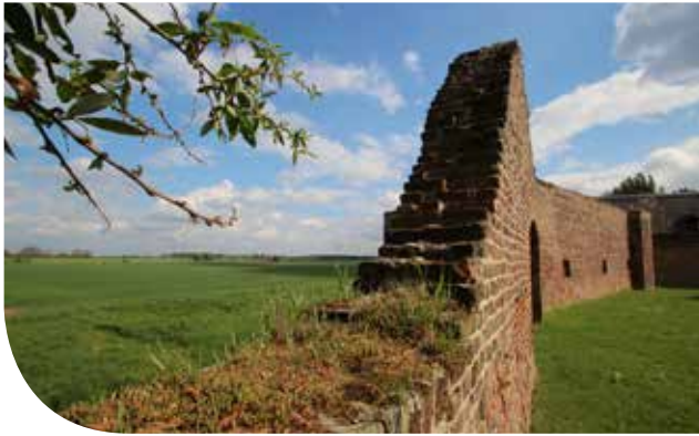
Der Blick über die Stadtmauern hinaus in die Natur.