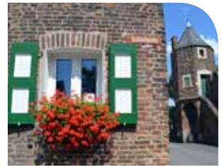
Ecke Schloß- und Rheinstraße, im Hintergrund eine „Pfefferbüchse“.