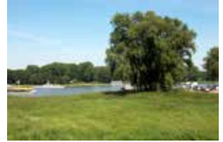
Mit der Fähre über den Rhein.