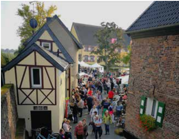
Buntes Marktleben am traditionellen Matthäusmarkt im September.

Der heutige Schloßplatz diente bis zum Jahre 1829 als Marktplatz. Hier schneiden sich Rheinstraße und Schloßstraße, die beiden so genannten Toreinfallstraßen . Bis 1832 befand sich im linkerhand gelegenen Haus mit der Nummer 5 das Zonser Rathaus. Unmittelbar dahinter führt ein Durchbruch in der Stadtmauer auf den Treidelpfad .