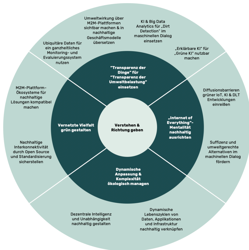
Abbildung 2: Herausforderungen an ein grünes Zusammenspiel der Technologien (eigene Darstellung)

Um ein grünes Zusammenspiel von Technologien in der Machine Economy zu etablieren, müssen wir uns den folgenden Herausforderungen und Wissenslücken stellen.