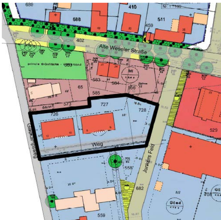
Abb.: Geltungsbereich der erneuten 49. Flächennutzungsplanänderung „Gansenbergweg“ in der Gemarkung Hünxe, Flur 2, Flurstücke 726, 727 728 teilw.

Die Planbereichsgrenzen der oben genannten Bauleitplanänderung können der nachfolgenden Planskizze entnommen werden: