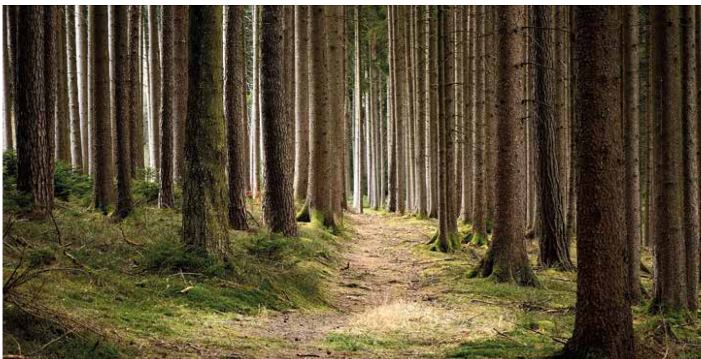
Klassische Monokulturen werden in der Forstwirtschaft mehr und mehr durch hitzeresistentere Arten ersetzt.

Axel Conrads: Wir verbrauchen in Deutschland jährlich rund 50 Mio. m 3 Beton. Die Sägeindustrie produziert im Jahr ca. 35 Mio. m 3 Holz, wir haben im Wald einen jährlichen Zuwachs von