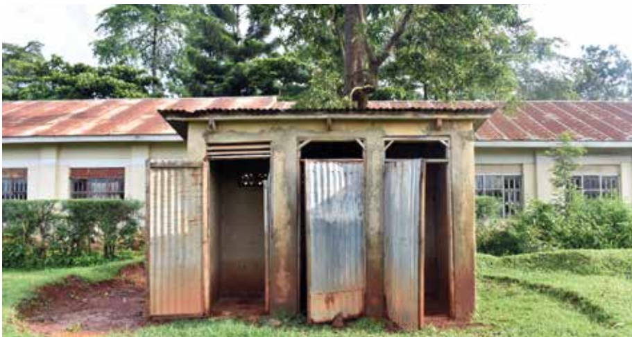
Toilettengebäude in Uganda

Die Tabelle rechts zeigt eine kleine Aus-