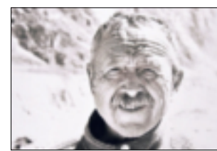
Ein Selbstbildnis in Schwarz und Weiß.

bekannt geworden sind, unterstreichen die extreme Beliebtheit der beiden Gymnasien. Prüfergebnisse und Umsetzungsfragen sollen auf Wunsch der CDU im Fach-Ausschuss Schule „lösungsorientiert“ erörtert werden. -gpm.