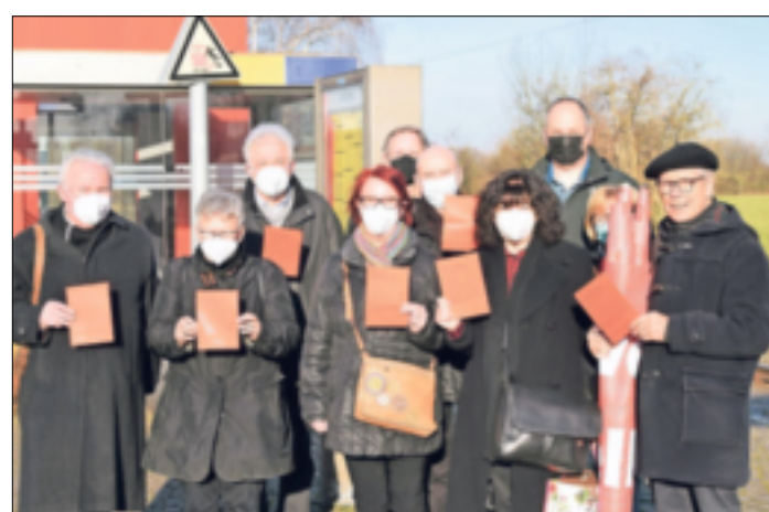
Rokis Delegation beim Treffen am Bahnhof (unten) und vor dem Kölner Dom (oben).