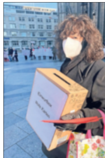
Über 800 „Roten Karten“ für Noch-Kardinal Woelki konnten von den Gillbach-Christen gesammelt werden.

gebieten, über den nun der Papst entscheiden wird. Auch wenn dies von den Protestierenden als erster Erfolg verbucht werden kann, sind damit noch lange nicht alle Probleme, die sie in der Amtskirche sehen, beseitigt. Deshalb wollen sie weiter aktiv bleiben. -gpm.