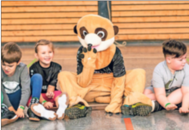
Natürlich ist auch das Maskottchen von Kids aktiv NRW dabei.