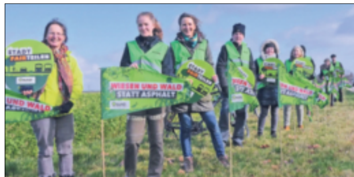
Die Ortsgruppe des BUND protestierte gegen den Umbau der Straße mit bunten Wimpeln.

diesen Kosten belastet. Dieses Geld sollte laut BUND eher für die Aufwertung des Wohnumfeldes, der Umwelt, in Klimaschutz und Klimafolgenminderung und Radfreundlichkeit investiert werden.