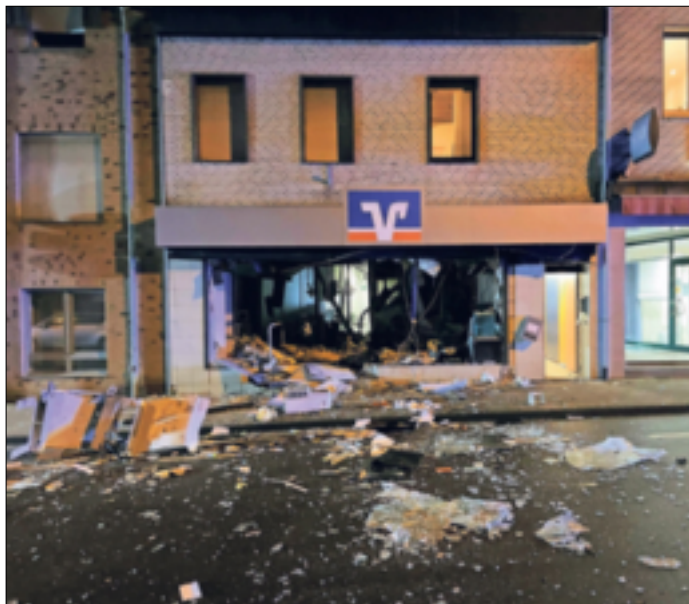
Ein absolutes Bild der Verwüstung – ein Glück, dass noch keinem Menschen etwas passiert ist.

Jüchen. Nach ersten Erkenntnissen flüchteten drei Personen mit einem Mercedes in Richtung Bundesautobahn A 44. Und genau dies scheint schon ein Grund zu sein, weshalb Jüchen gerne in den Fokus der Verbrecher gerät: Die Autobahnverbindungen sind gut, eine Flucht kann schnell erfolgen. Zwar hatte die Polizei bei der Fahndung noch die Verfolgung aufgenommen, doch dabei kam es zu einem Unfall mit dem flüchtenden Fahrzeug. Der Streifenwagen wurde dabei schwer beschädigt und ein Polizist an der Hand verletzt. Die Frage nach der Tatbeute ist nunmehr Gegenstand kriminalpolizeilicher Ermittlungen. Zur Unterstützung bei der Tatortaufnahme erschienen Spezialkräfte des Landeskriminalamtes NRW vor Ort. Und allen Beamten bot sich ein absolutes Bild der Verwüstung: Der Vorräum der Bank war komplett zerstört. Autos, die vor dem Geldinstitut geparkt hatten, waren schwer beschädigt oder sogar ganz demoliert. Bisher wurde bei einer solchen Sprengung kein Mensch verletzt – doch bei dem Ausmaß der Detonations-Schäden ist nicht auszuschließen, dass auch ein Anwohner einmal verletzt werden könnte. Innerhalb der vergangenen