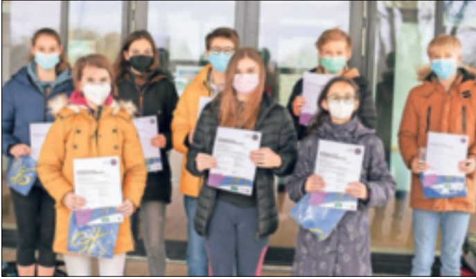
Die SG Gierath engagiert sich für die Ausbildung von jungen Sporthelfern – ein toller Gewinn für den Verein.