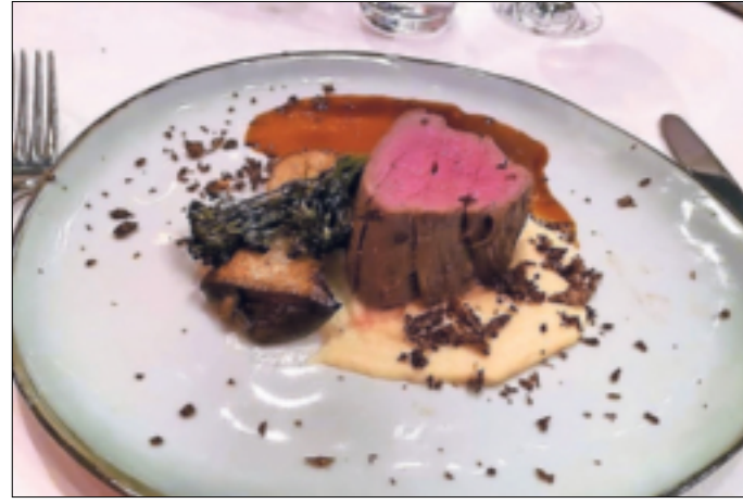
Im Hauptgang können sich die Dinner-Gäste auf Zweierlei vom Rind freuen.