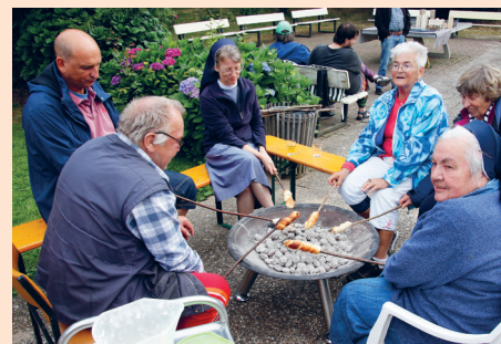
Zusammensein beim Stockbrot

Mit vielen konkreten Ideen, die wir im TaK umsetzen möchten, sind wir nach Hause gefahren. Geplant haben wir einen Martinsbasar am 16. bis 17. November, wo wir solche Produkte wie Wachstücher, Insektenhotels u.a. verkaufen wollen. Neben den konkreten Ideen sind wir aber vor allem auch gestärkt und beglückt in den TaK zurückgefahren durch das schöne Miteinander während dieser Tage. |