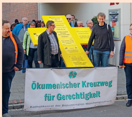
Kreuzwegstation am Kaufhof

Der ökumenische Kreuzweg der Gerechtigkeit am 22. 3. 2019 mit dem Leitgedanken „Soziales Mönchengladbach für alle – in welcher Stadt wollen wir leben?“ führte gut 100 Personen von der Friedenskirche Eicken über Hauptbahnhof, Kaufhof, Sonnenplatz zum Arbeitslosenzentrum. Der Volksverein und der Treff am Kapellchen gestalteten die Station am Kaufhof. angelehnt an das Zitat aus dem Buch Exodus: Ein Land, wo Milch und Honig fließen . Die Teilnehmenden wurden mit Fragen konfrontiert: „Was wünschen Sie sich? Was braucht es für unsere Stadt Mönchengladbach, dass hier Milch und Honig fließen, d.h. ein gutes Leben möglich