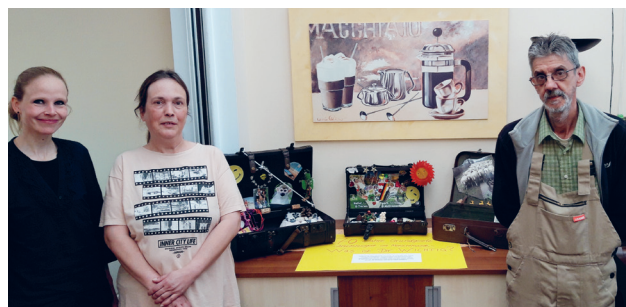
Was ist mir wichtig? Die Koffer machen es greifbar.

Die Erörterung der Inhalte des Grundgesetzes führte zu einer Auseinandersetzung über gesellschaftliche und persönliche Werte. Lebhaftige Diskussionen wurden durch ein Spiel mit dem Grundgesetz