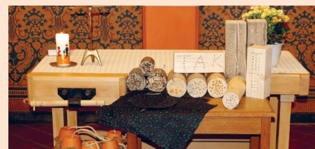
Neue TaK-Produkte zum Schutz der Umwelt

Hauses“ an. So entstanden Insektenhotels für Wildbienen, Florfliegen und Ohrklammer und Wachstücher, mit denen man Lebensmittel abdecken kann (außer Fleisch) und somit Plastik- oder Alufolie vermeiden kann.