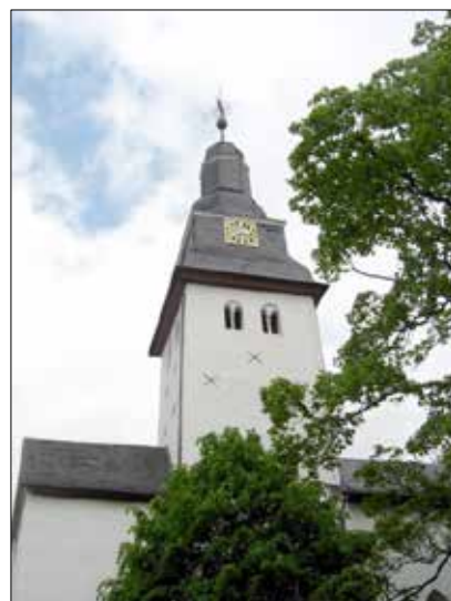
Blick auf den Kirchturm der Ev. Kirche in Nümbrecht.

Time of creation 29 Oct. 2004 Licence GNU FDL and CC-by-SA Camera Canon S 45