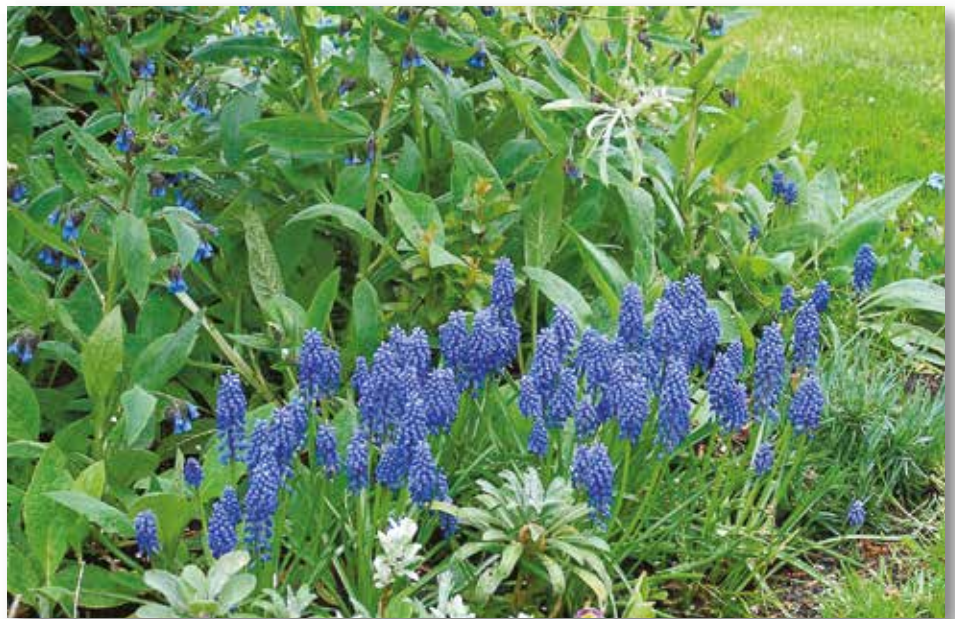
Traubenhyazinthen pflanzt man am besten in größeren Gruppen. Sie passen gut zu Lungenkraut und Vergissmeinnicht.

wird. Daher sollte man auch nicht zu früh mit der Pflanzung beginnen.