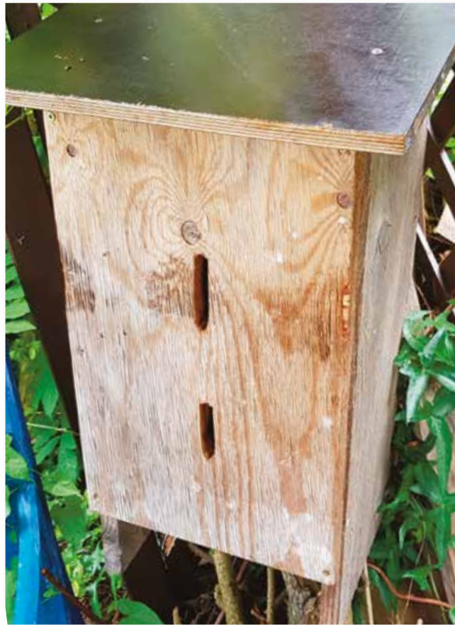
Ein Hornissenkasten lockt die nützlichen Helfer in den Garten.

Seit einigen Jahren ist die Asiatische Hornisse auch in Europa auf dem Vormarsch. Sie hat vor allem in Frankreich Fuß gefasst und besiedelt nun auch