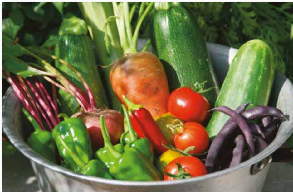
Aus dem Stadtgarten kann man jetzt täglich reife Tomaten, Paprika, Zucchini, Gurken, Bohnen und vieles mehr mit nach Hause nehmen oder an Nachbarn und Freunde verschenken.

Kirschen, Mirabellen und frühe Pflaumen sind bereits geerntet. Wer die Bäume auslichten möchte, muss sich beeilen, denn der Sommerschnitt an Steinobstbäumen sollte bis Mitte August erledigt sein. Regelmäßig Fallobst aufsammeln, die abgeworfenen Früchte locken Wespen an. Flugfähige Frostspannerweibchen machen sich in den kommenden Wochen zur Eiablage auf den Weg in die Obstbäume. Ein etwa 20 cm breiter Streifen aus Karton, in 50 cm Höhe fest um den Stamm gewickelt, bietet ihnen Gelegenheit dazu, bevor sie die Krone erreichen. Später entfernt man die Pappe mitsamt der Gelege. An traditionellen Leimringen verenden auch viele nützliche Insekten, manchmal sogar kleine, neugierige Singvögel. Sie sind daher nicht geeignet. Fruchtgemüse und hungrige Kohlgewächse wöchentlich mit Tomatendünger oder verdünnter Beinwelljauche versorgen. Alle paar