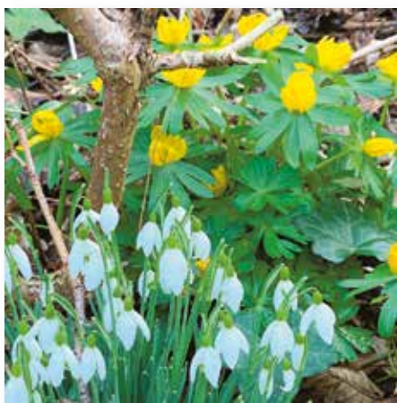
Schneeglöckchen und Winterlinge decken den Tisch mit Pollen und Nektar für die ersten Insekten im Frühling

Nun heißt es, die Zwiebeln pflanzen. Je größer die Zwiebeln sind, desto tiefer sollten sie platziert werden. Dabei muss man auch darauf achten, dass das Loch tatsächlich groß ist, dass der Boden der Zwiebel im Loch aufsitzt. Etwas Sand auf dem Boden des Pflanzlochs ist hilfreich, damit das Wasser gut abfließt, bis die Wurzelbildung einsetzt. Dieses geschieht, wenn es kühler