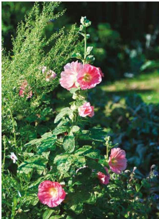
Die Stockrose ist eine typische Bauerngartenpflanze.

Im Garten zeigen sich die Pflanzen robust und unkompliziert. An windigen Standorten sollte man ihnen aber im ausgewachsenen Stadium einen Stützstab gönnen, da sie ansonsten leicht umfallen. Die Stockrose ist zweijährig, also bildet sich im ersten Jahr lediglich eine Blattrosette, im zweiten erst entwickelt sich der Blütenstand. An diesem bilden sich Ähren mit den bekannten großen Blüten in spektakulärer Farbvielfalt. Der Stängel der Stockrose ist kaum verzweigt und wächst kerzengerade in die Höhe. Die gesamte Pflanze ist mit leicht stacheligen Haaren überzogen. Die kräftigen, handtellergroßen Blüten erscheinen von Juli bis September. Es gibt sie sowohl gefüllt als auch ungefüllt in einer großen Farbvielfalt von weiß über gelb, apricot, rosa oder rot bis hin zu einem dunklen violett und und sogar schwarz.