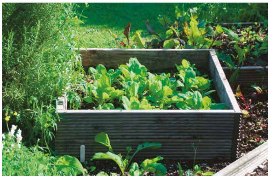
Für die späte Ernte im Herbst und Winter ist Spinat ideal. Jung geschnittene Blätter schmecken angenehm mild.

ten Feldsalat, Radicchio, Spinat und Asia-Salate säen. Gemüsebeete, deren Böden eine Frischekur benötigen, mit Gründüngung einsäen. Der Fachhandel bietet eine Auswahl an Saatgut an. Hat man seine Parzelle gerade erst übernommen, ist eine professionelle Bodenanalyse sinnvoll. Dazu entnimmt man an verschiedenen Stellen Bodenproben und sendet sie an ein Speziallabor. An Bodenbeschaffenheit und Standort stellen Brombeersträucher keine besonderen Ansprüche. Ihre Ranken werden nach der Ernte bodentief abgeschnitten. Diesjährige Triebe am Rankengerüst entlangleiten und gut befestigen. Sie müssen den Herbst- und Winterstürmen standhalten und die Ernte des kommenden Jahres tragen. Eine pikante Angelegenheit, bei der das Tragen anständiger Gartenhandschuhe Pflicht ist, denn leider haben die aromatischsten Sorten Dornen. Der Anbau dornenloser Züchtungen ist ein guter Kompromiss, wenn auch kleine Kinder die Beeren pflücken möchten. Bis Ende August neue Erdbeerpflanzen setzen und gut wässern. So tragen sie schon im kommenden Jahr viele süße Früchte. Im Kräuterbeet ist Erntezeit bei Salbei, Rosmarin, Thymian & Co. Zweige zu kleinen Sträußchen binden und an einem luftigen, schattigen Platz zum Trocknen aufhängen. In luftdichten Behältern kühl und