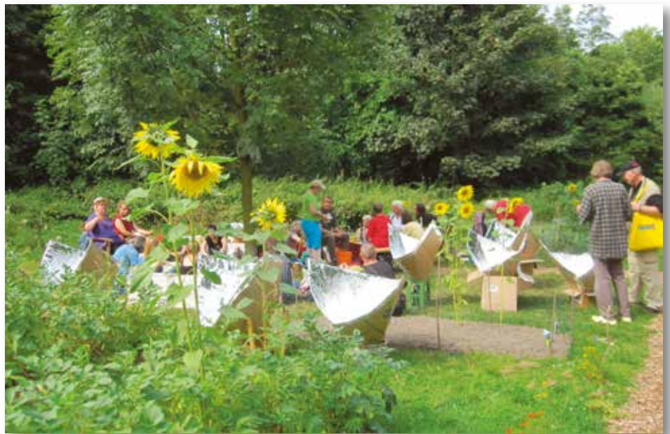
Der erste Gemeinschaftsgarten in Essen: der Siepengarten in Bergerhausen

Immer mehr Menschen suchen eine solche grundlegende Veränderung und kön-