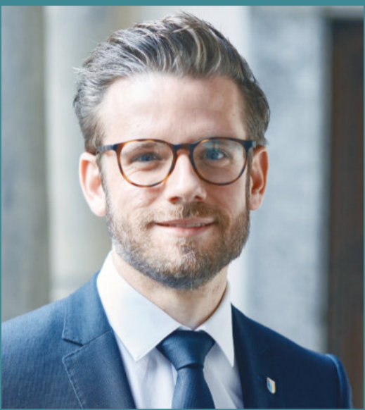
Liebe Mönchengladbacherinnen, liebe Mönchengladbacher,

Impfberechtigt sind zunächst alle Personen, die das 80. Lebensjahr vollendet haben. Auch wer sein Infoschreiben verlegt hat oder gerade neu nach Mönchengladbach gezogen ist, kann sich auf der Internetseite www.116117.de oder unter der Telefonnummer 0800 116 117 01 für die Impfung anmelden. Bürgerinnen und Bürger, die nach dem 31. Januar Geburtstag haben, können sich anmelden, sobald sie 80 geworden sind.