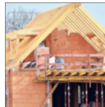
Viele Materialien sind aktuell knapp.