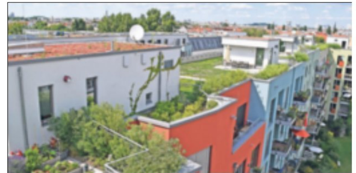
In luftiger Höhe entstehen grüne Gärten.

gekommen. Zudem wurden im Jahr 2019 etwa 90.000 Quadratmeter Fassadenfläche bepflanzt. Für viele Hausbesitzer ist die Gebäudebegrünung nicht nur ökologisch attraktiv. Rund 25 Prozent der deutschen Städte mit mehr als 50.000 Einwohnern fördern Dach- oder Fassadenbegrünungen auch finanziell. Viele Kommunen mindern zudem die Niederschlagswassergebühr beim Vorhandensein von Gründächern. Welche Städte das sind, können Interessierte auf www.gebaeudegruen.info nachlesen. Dort stehen eine Übersicht sowie der genannte Marktreport zum Download bereit. Insgesamt ist der Anteil an Städten, die direkte Zuschüsse anbieten, gestiegen. Waren es 2010 nur sechs Prozent, bewilligten in 2019 bereits 19 Prozent der deutschen Städte eine finanzielle Förderung von Gründächern. Ein ähnlicher Anstieg ist für die direkte Bezu-