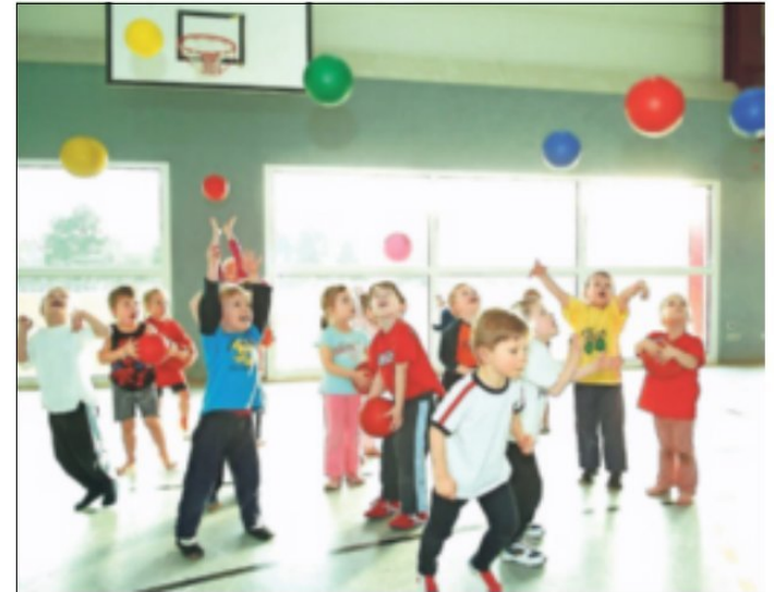
Ausgelassener Sport vor der Pandemie. Jetzt äußerten die Vereine, wie die Corona-Zeit für sie ist.

Dennoch bleiben die Probleme nicht von der Hand zu weisen: Mitgliederzahlen sinken. So musste ein Verein sogar die Kündigungen von 135 Mitgliedern annehmen. Diese Sorge spiegelt sich auch in der Umfrage: Fast 54 Prozent der Vereine sehen den Mitgliederrückgang als größtes Problem der Pandemie. Dazu