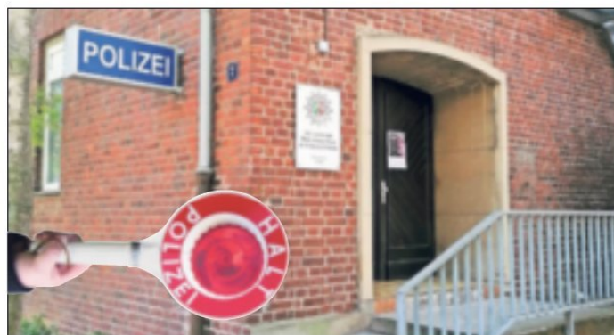
Sie ist wahrlich in die Jahre gekommen: die Wache der Polizei mitten in Jüchen.

Es ist ein Thema, das ständig hochkocht: Die Polizeiwache in Jüchen ist nicht rund um die Uhr besetzt. In Diskussionen unter den Bürgern kommt immer wieder zur Sprache, dass das subjektive Sicherheitsempfinden genau davon beeinträchtigt sei. „Keine Sorge“, sagt die Polizei, es sei immer ein Kontakt zur Polizei möglich und Einsätze könnten unmittelbar eingeleitet werden. Nicht das einzige Thema rund um die Polizei: Auch über den Zustand des Gebäudes wird immer wieder spekuliert.