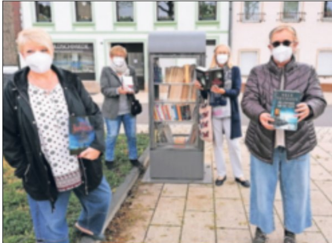
Die Paten des Bücherschranks freuen sich über das Projekt in Hochneukirch.

Bewusst wurde deshalb auch der Ort ausgesucht: Hier steht er so, dass viele Leute ihn im Blick halten können. Die Paten sind sich sicher: „Schauen Sie mal in unseren Schrank und Sie finden sicher eine tolle Lektüre.“ Julia Schäfer