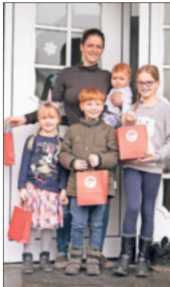
Die sportliche Familie Fara freute sich über vier Bewegungstüten.

Gierath. Die Mitglieder der SG RW Gierath konnten zu Jahresbeginn an einer abteilungsübergreifenden Malaktion teilnehmen, die von Venka Koglin und dem J-Team des Vereins ins Leben gerufen wurde. Die kleinen Kinder bis vier Jahren durften Bewegungsmotive des LSB Ki-