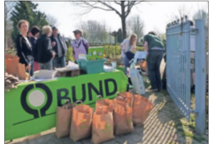
Ein Aktionsfoto zum torffreien Gärtnern aus der Vor-Corona Zeit mit Abgabe von Komposterde.

Der BUND Jüchen und die BUNDSpechte hatten in den vergangenen Jahren verschiedene Aktionen in Jüchen durch-