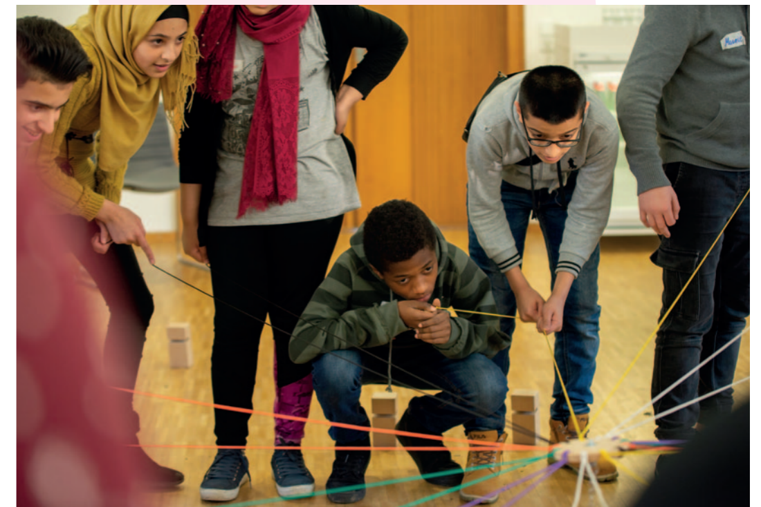
Kooperationsübungen befördern eine konstruktive Lernatmosphäre.

Zwei Jahre nachdem die Analyse „Außerschulische politische Bildung mit jungen Geflüchteten“ (zum Download auf der Website www.empowered-by-democracy.de ) die Erfahrungen der projektbeteiligten Träger im Themenfeld Flucht und Migration bündelte und Herausforderungen für die Weiterentwicklung benannte, werden im vorliegenden Text die Stimmen von jungen Teilnehmenden des Projekts „ Empowered by Democracy “ im Mittelpunkt stehen. Im Sommer 2019 wurden 22 Jugendliche zu Gesprächen eingeladen. Themen der qualitativen – und natürlich für die Jugendlichen freiwilligen – Interviews waren ihre Lebenssituation ebenso wie das Erleben der Demokratie in Deutschland und ihre Lern-erfahrungen und -erlebnisse im Rahmen von „ Empowered by Democracy “. Von besonderem Interesse hinsichtlich letzterer waren die verwandten Methoden und didaktischen Formate sowie die spezifischen thematischen Interessen der jungen Menschen.