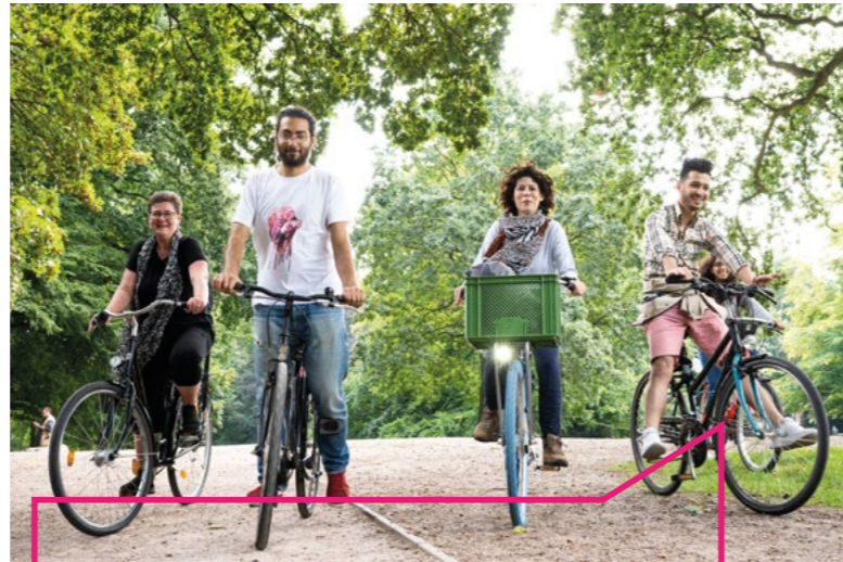
Präventive Angebote an bundesweit rund 190 Standorten

Eine eigene Säule im Programm bilden die Bildungsangebote von Trägern der politischen Jugendbildung in der GEMINI, die in Kooperation mit den Respekt Coaches an Schulen umgesetzt werden. Thematisch stehen hier vor allem Bildungsangebote zu Mobbing, Persönlichkeitsstärkung, Respekt und Toleranz, Religion und Identität oder auch die Reflexion von Geschlechterrollen im Vordergrund. Zentrales Ziel der Angebote der politischen Bildung im Programm ist es, die Selbstpositionierung und Resilienz von Jugendlichen zu stärken und demokratische Aushandlungsprozesse zu üben. Die beteiligten Teilprojekte der GEMINI verfolgen in diesem Sinne einen primärpräventiven und ressourcenorientierten Ansatz und richten sich an alle Jugendlichen, unabhängig von Religion und Herkunft. Sie wollen insbesondere diejenigen stärken, die extreme Ansprachen erkennen und sich aktiv dagegen zur Wehr setzen wollen. In diesem fachlichen Selbstverständnis folgen die Träger der politischen Jugendbildung einem Präventionsbegriff, der in der Arbeit mit jungen Menschen an den Stärken und dem demokratischen Gestaltungswillen der Jugendlichen