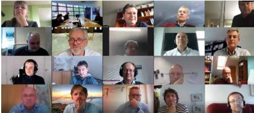
Rund 40 Kammermitglieder versammelten sich zur digitalen Konferenz.

Der Coronapandemie gelingt es nicht, das wichtige Thema Umwelt und Klimaschutz von der Agenda zu streichen. Auf Einladung des Ausschusses Nachhaltigkeit diskutierten rund 40 Mitglieder der IK-Bau NRW in einer Zoom-Konferenz Ende Oktober über das Thema Mobilität. In einem lebendigen Austausch fügten sich die geteilten Erfahrungen zu einem Bild, das eine sich dynamisch entwickelnde Mobilität zeigt.