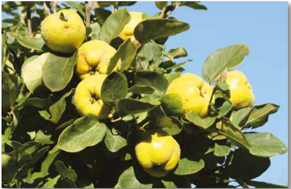
Quitten sind steinhart und roh ungenießbar – zu Gelee, Konfitüre oder Likör verarbeitet, erinnern sie noch lange nach dem Pflücken an diesen besonderen Sommer 2020.

Färben sich Quitten von grün nach gelb, sind sie erntereif und sollten auch zügig gepflückt werden. Verbleiben sie zu lange am Baum, wird ihr Fruchtfleisch dunkel und sie lassen sich nicht lange lagern. Anschließend die Zweige zurückschneiden, die Früchte getragen haben. Letzte Äpfel ernten und aus allen Obstbäumen die braunen, schrumpeligen Fruchtmumien entfernen, sie beherbergen Pilzsporen und Krankheitserreger. Bei reicher Ernte einwandfreie Äpfel an einem kühlen, luftigen Ort, z.B. in der Laube, einlagern. Früchte mit etwas Abstand auf Zeitungspapier in Kisten legen und unbedingt regelmäßig kontrollieren. Obstbäume können in den kommenden Monaten ausgeleitet bzw. zurückgeschnitten werden. Verteilt man die Arbeit über mehrere Tage, geht sie leichter von der Hand. Schnittgut häckseln und als Mulchdecke auf Beeten oder naturbelassenen Wegen verteilen. Alternativ kann man in einer geschützten Ecke mit den Ästen einen Totholzhaufen anlegen, der als