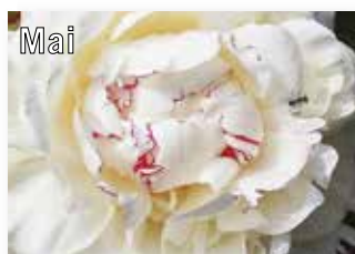
Norbert Strötgen KGV Bremerstraße e.V.