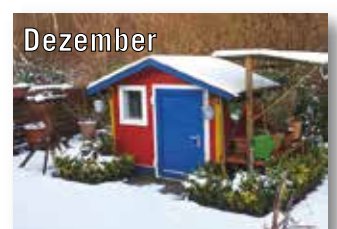
Uwe Sadrozinski KGV Schonnebeck e.V.