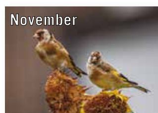
Karl-Heinz Hack GF Sachsenring e.V.