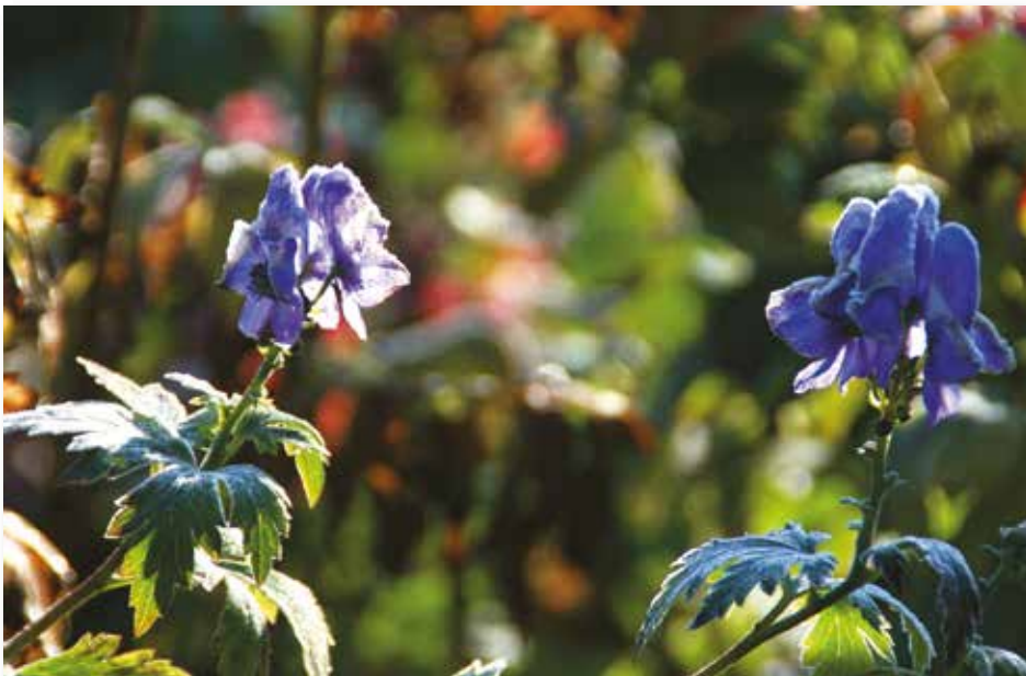
Leuchtende Blüten des giftigen Blauen Eisenhuts bringen spät im Jahr Farbe in den Garten und spendieren Hummeln und Wildbienen Nahrung, die um diese Zeit immer rarer wird.

Nach den ersten Nachtfrösten Dahlien ausgraben und Stiele bis auf 10 cm abschneiden. Die Knollen vorsichtig von Erde befreien, in Zeitungspapier wickeln und frostfrei einlagern. Gelegentlich kontrollieren. Etikett nicht vergessen! Einige Rosensorten bereiten uns mit ihren Blüten noch Freude bis in den Dezember hinein. Triebe, die keine Knospen mehr tragen, um etwa ein Drittel einkürzen. Die restlichen später, nach der Blüte zurückschneiden. Der Rückschnitt bewahrt die Pflanzen, vor allem Kletterrosen und Hochstämmchen vor Sturmschäden, da sie den Windböen weniger Angriffsfläche bieten. Stauden bitte nicht zurückschneiden. Ihre Samenstände bieten Vögeln Nahrung, die welken Blätter und Stängel Insekten Schutz. Herbstzeit ist Pflanzzeit: Der Fachhandel bietet wurzel-nackte Gehölze an (die wesentlich preiswerter sind als getopfte Ware) z.B. zur Neuanlage einer Hecke oder als Ersatzpflanzung für entfernten Kirschlorbeer. Sie müssen jedoch zügig eingesetzt werden. Vor dem Einpflanzen gut wässern und bei anhaltender Trockenheit durchdringend gießen. Wahre Wunder bei Neupflanzungen von Sträuchern, Stauden, Obstbäumen und Rosen bewirkt die Zugabe von Mykorrhiza-Pilz-