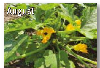
Nadine Fittinghoff KGV Amalie 94 e.V.