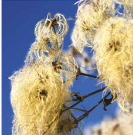
Die puscheligen Samenstände der wilden Clematis überdauern die kalte Jahreszeit an der Pflanze. Sie sehen im milden Oktoberlicht wie kleine Kunstwerke aus.

Offene Komposthaufen mit einer Schicht Erde bedecken, einige Lagen unbehandelte Pappe auflegen und mit Steinen oder Brettern beschweren.