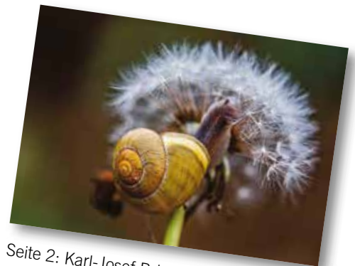
Seite 2: Karl-Josef Brinkemper KGV Sachsenring e.V.