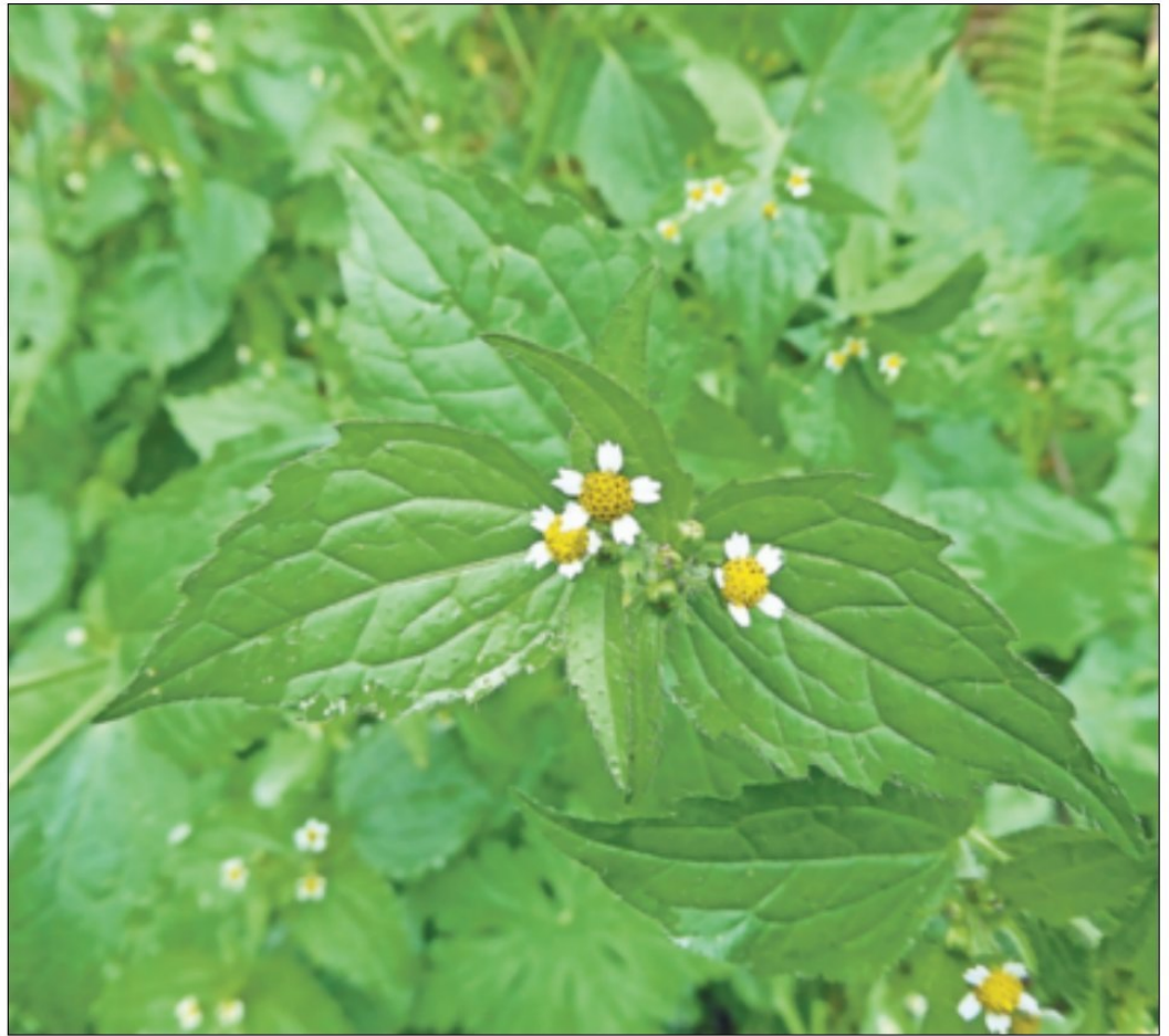
Das Franzosenkraut oder Knopfkraut hat sich so erfolgreich in Deutschland eingelebt, dass es zu einem weit verbreiteten Acker- und Gartenkraut geworden ist.

Franzosenkrautes, das kleinblättrige und das haarige, zottige oder raue Franzosenkraut. Im englischen heißt das haarige Knopfkraut „shaggy soldier“, also struppiger Sol-