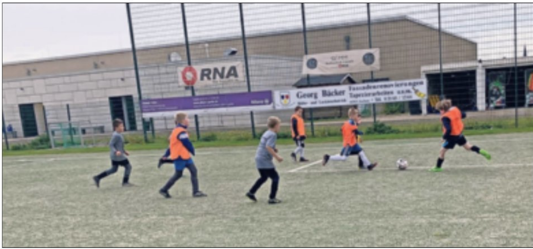
33 Nachwuchskicker trainierten in den Herbstferien mit professionellen Trainern der „Fußballschule Grenzland“.