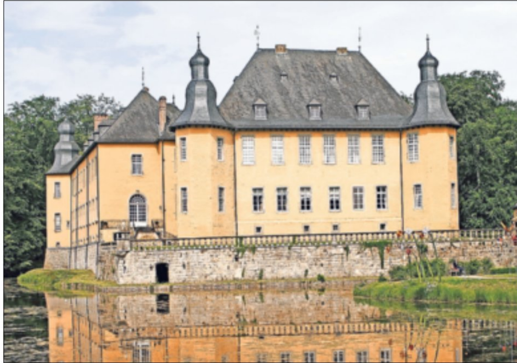
Im Schloss Dyck gibt es aktuell eine Ausstellung mit Garten-, Pflanzen- und botanischer Fotografie zu sehen.

Bücherei: Die „St. Martinus“-Bücherei in Bedburdyck