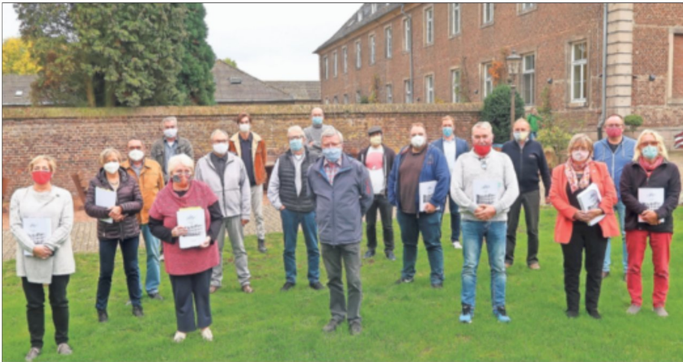
Die Mitglieder der SPD-Fraktion vor dem Nikolauskloster. Dort traf sich die neugebildete Ratsfraktion zu einer dreitägigen Klausurtagung.