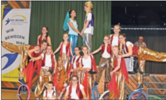
Im Februar schien die Welt noch in Ordnung: Bei der Spiel-Sport-Show des SSV präsentieren Vereine immer ihr Können. Jetzt geht es für die Vereine darum, mit dem kleinsten möglichen Schaden aus der Corona-Krise zu kommen.