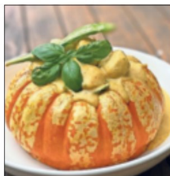
Jochen Roelen und die Kürbisse: Er testet gerne neue Sorten aus – auf dem Feld und auf dem Teller.