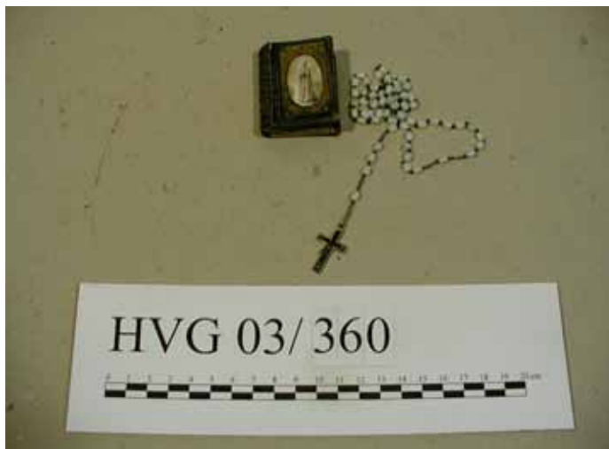
Objekt: Rosenkranz, Behälter in Buchform; Material: Eisen versilbert, Perlmutter, Papier; Datum: Ende 19. Jahrhundert

In loser Folge werden hiermit die einzelnen Objekte einer größeren Öffentlichkeit vorgestellt.