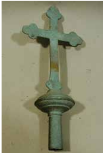
Objekt: Vortragekreuz; Material: Eisen.