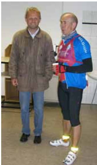
Am Samstag, 30.04.2011, machte sich eine Radsportgruppe von 36 Personen auf

zu einer Nacht- und Tagestour über eine unfassbare Etappe von 400 Km. Start war um 20:00 Uhr in Herentals.