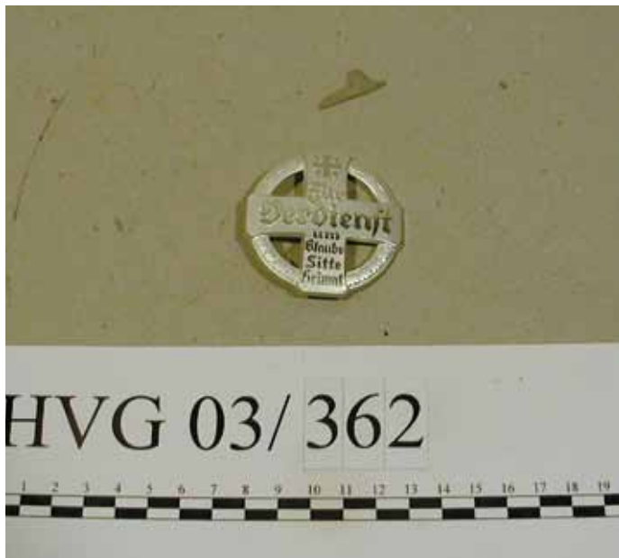
Objekt: Schützenmedaille; Material: Aluminium.

Zentrale Abschlussprüfungen. Die Volkshochschule bietet montags, ab 2. Mai, 16.30-18.00 Uhr für den Bereich Mathematik einen Vorbereitungskurs auf die zentrale Abschlussprüfung (Sekundarstufe I) für Schülerinnen und Schüler an. Besprochen werden die prüfungrelevanten Themen und mit Hilfe von Beispielaufgaben vertieft. Informationen und Anmeldung bei der VHS in Rheinberg unter Tel.: 02843/90740-0 oder www.vhs-rheinberg.de .