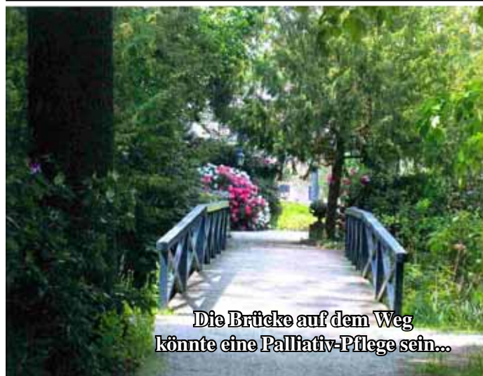
Die Brücke auf dem Weg könnte eine Palliativ-Pflege sein...

Aus der Reihe: Chancen des Alltags Begleitung in der letzten Lebensphase Was ist eine Palliativ-Pflege?