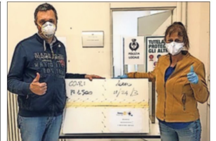
Im „Edo di Bergamo“ wurde über die Spendenübergabe (Foto oben) an die örtliche Kinderklinik berichtet. Ein innovatives System zur Videoskopie der Atemwege soll so unterstützt werden. Aber auch in der Region spendeten die „Rotarier“ (unten: „Tafel Rommerskirchen“).