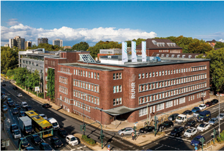
Verbandsgebäude Regionalverband Ruhr (RVR), (Dienstszitz seit 1927)

Der Regionalverband Ruhr wurde 1920 als Siedlungsverband Ruhrkohlenbezirk mit Sitz in Essen gegründet. Damit wurde erstmals eine Einrichtung geschaffen, die das gesamte Ruhrgebiet themenübergreifend verknüpft. Diese wichtige Funktion erfüllt der RVR auch heute noch.