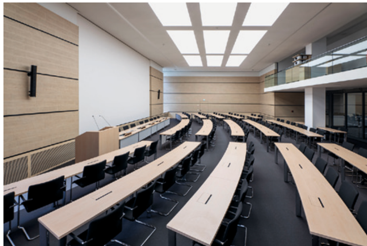
Plenarsaal der Verbandsversammlung

Er setzt sich zusammen aus den Oberbürgermeisterinnen/-meistern und Landrätinnen/-räten des Ruhrgebiets.