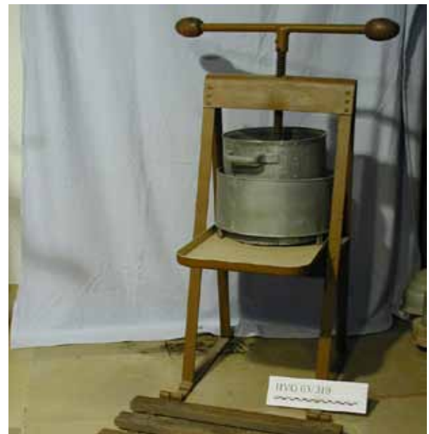
Objekt: Rübekrautpresse; Material: Eisen, Holz; Erwerb von: am. Karl Scholten; ca 1940

In loser Folge werden hiermit die einzelnen Objekte einer größeren Öffentlichkeit vorgestellt.