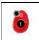
Treffer = 1 Osterei