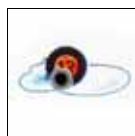
Treffer = 4 Ostereier

Beide Verein freuen sich über eine rege Beteiligung ihrer Mitglieder sowie aller interessierten Mitbürgerinnen und Mitbürger aus Menzelen. Die Vorstände wünschen allen Mitgliedern, Mitbürgerinnen und Mitbürgern sowie ihren Familien