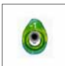
Treffer = 1 Osterei

Und so funktioniert's: Jede Schützlin und jeder Schütze erhalten Glückskarten im verschlossenen Umschlag (1,50 € pro Stück). Pro Umschlag dürfen 8 Schuss abgegeben werden. Für jedes getroffene Ei gibt es ein hart gekochtes Osterei, für jedes getroffene Spiegelei gibt es vier hart gekochte Ostereier: