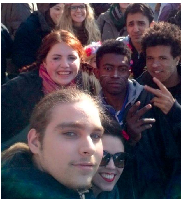
Karneval in Solingen: Erst Kulturschock - dann Vergnügen