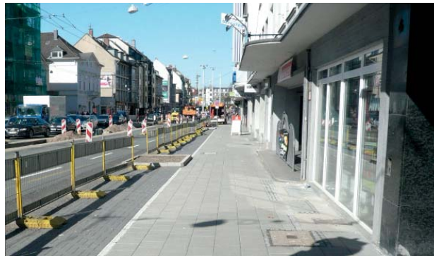
Konrad-Adenauer-Straße erster Bauabschnitt

Im November 2014 hat der Rat die Erweiterung des räumlichen Geltungsbereiches für das Hof- und Fassadenprogramm beschlossen. Damit können mehr Eigentümer in der Nordstadt von den möglichen Zuschüssen zur Aufwertung Ihrer Immobilie profitieren. Informationen unter www.solingen.de/hofundfassadenprogramm oder Stadtdienst Stadtentwicklung, Jens Wolter, 290-2154, j.wolter@solingen.de