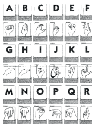
Ausschnitte aus dem Gebärdensprachealphabet