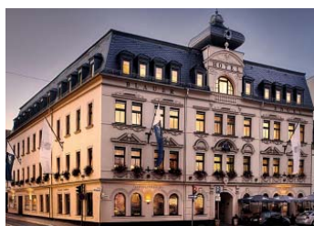
Das Hotel „Blauer Engel in Aue

• Anreise über Lichtenstein mit Besuch im Daetz-Centrum