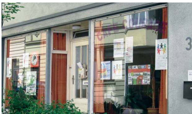
Das Café Courage auf der Klemens-Horn-Straße

Die Erlaubnis zum Besuch eines Deutschkurses ist für die Flüchtlinge abhängig vom Aufenthaltsstatus. Und selbst, wenn sie die Genehmigung bekommen, sind die Plätze in den Kursen oft belegt und es gibt lange Wartelisten. Deshalb biete ich inzwischen seit Dezember 2014 jeden Donnerstag von 10.30 bis 12.30 Uhr interessierten Flüchtlingen die Möglichkeit, in einem niederschweligen Angebot im Café Courage Hilfe zum Erlernen der deutschen Sprache zu bekommen.