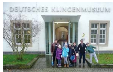
Die Gruppe vor dem Klingensmuseum