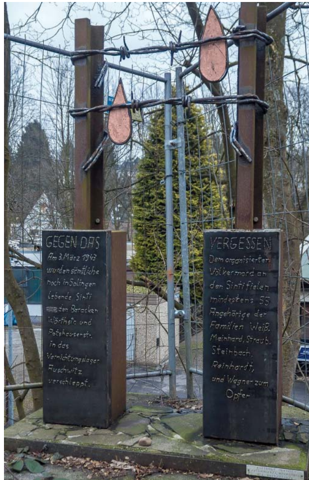
Die Gedenkstätte an der Korkenziehertrasse unweit des Nordbahnhofs

1994 beschrieb der heutige Leiter des Stadtarchivs, Ralf Rogge, deren Schicksal in der Dokumentation „Solingen. Eine Stadt und ihre ausländischen BewohnerInnen.“ Es brauchte dann noch 13 Jahre, bis in der Solinger Nordstadt, der Nähe des Standorts der Baracke Potshauser Straße an der Korkenziehertrasse zwischen Klaubberger Straße und Cronenberger Straße ein Mahnmal für die Solinger Sinti entstand. Die besondere Bedeutung dieses Mahnmals in der Solinger Nordstadt wird in der Veröffentlichung der Bezirksregierung Arnsberg „Begegnung und Verständigung. Sinti und Roma in NRW“ hervorgehoben: „Eines der ausdrucksstärksten Mahnmale in NRW ist 2007 in Solingen enthüllt worden. Es ist ein Zeichen