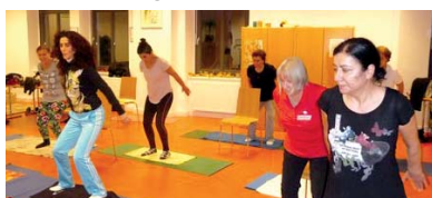
Pilates für Frauen im MGH

gemeinsamen Regeln und die Bedeutung von Fairplay. Ei-