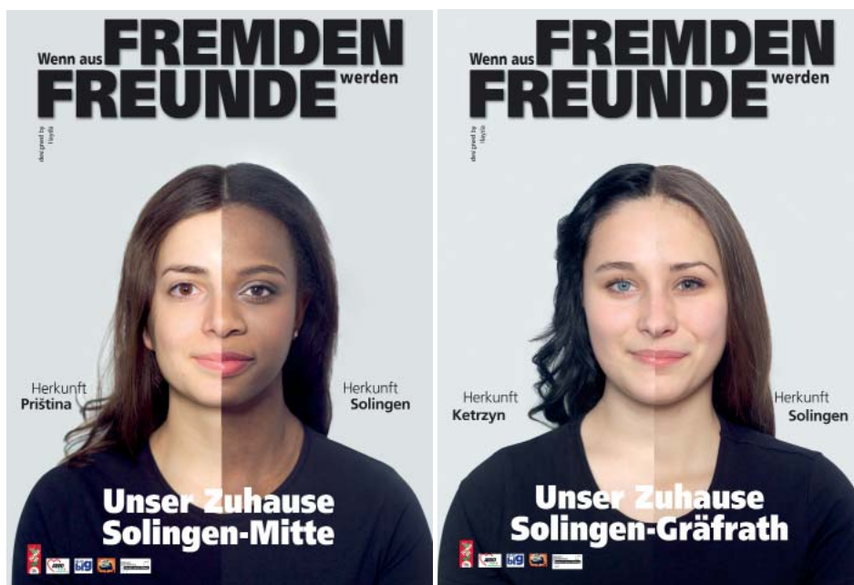
Plakate aus der Projektreihe „Wenn aus Fremden Freunde werden“

Das Projekt verfolgt das Ziel, junge Menschen, die nach Solingen geflüchtet sind, mit gleichaltrigen gebürtigen SolingerInnen zusammenzubringen, ihnen das Ankommen in der neuen Heimat zu erleichtern und gemeinsam eine gute Zeit zu verbringen. So haben die Jugendlichen in der Vorweihnachtszeit gemeinsam bunte Plätzchen gebacken und gleich danach auch verputzt. Im Januar haben die einheimischen Jugendlichen ihre Paten beim Schlittschuhlaufen ganz schön auf's Glatteis geführt. Wer schon sicher auf dem