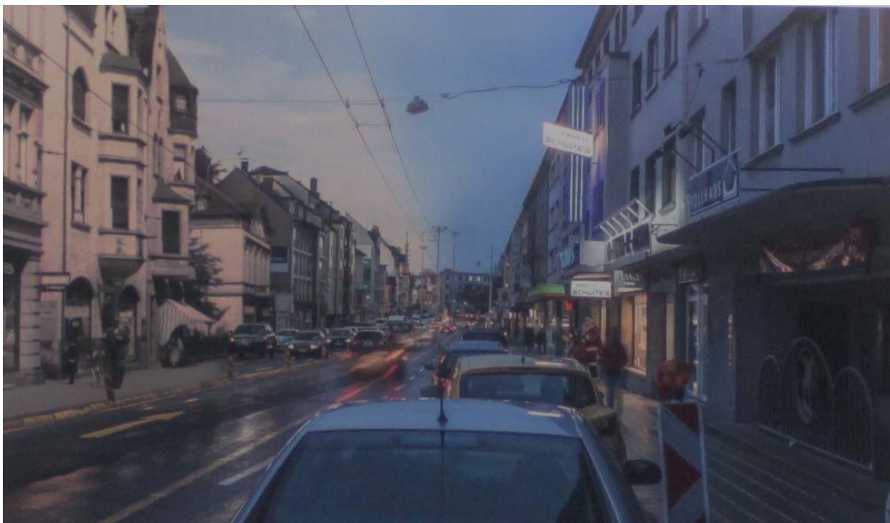
Montage aus drei Bildern der Konrad-Adenauer-Straße