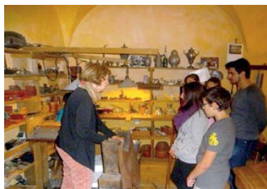
Die Zinngießerei war besonders interessant

Zunächst erfuhren die Kinder, warum Solingen als Klingensstadt bezeichnet wird und wir befassten uns genauer mit der Geschichte Solingens. Daraufhin wurden sie durch das Museum geführt und waren begeistert von den Sammlungen und Ausstellungen.