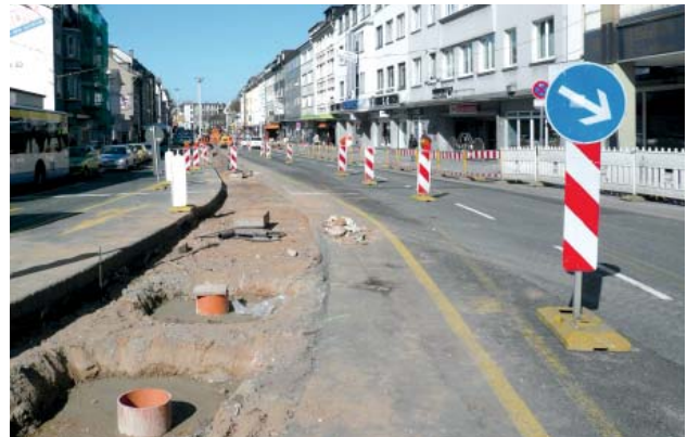
Im Mittelstreifen des ersten Bauabschnitts wird die Entwässerung vorbereitet